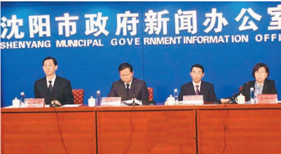
■瀋陽市中小企業局副局長關懷（右二）在4月2日舉辦的新聞發佈會上介紹「助保貸」業務。

香港文匯報訊（記者 于珈琳 瀋陽報道）記者日前從遼寧省瀋陽市新聞發佈會上獲悉，瀋陽市探索政銀合作的新舉措——由瀋陽市政府與中國建設銀行遼寧省分行共同開展的首個「助保貸」業務，將向難以獲得銀行信貸支持的小微企業開闢新的融資管道。據悉，首個「助保貸」業務最快將於本月放款。