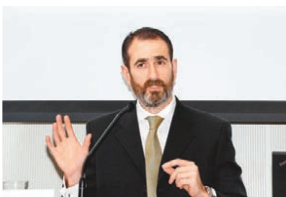
國際貨幣基金組織駐港分處代表羅翰明。不達標或對港造成負面影響，羅翰明認為，現時並無跡象顯示內地經濟增長會明顯放緩，內地調整增長步伐乃好事，可為經濟帶來更穩定及持續增長，減少依賴由信貸增長推動，可減少市場波動，對港亦有好處。