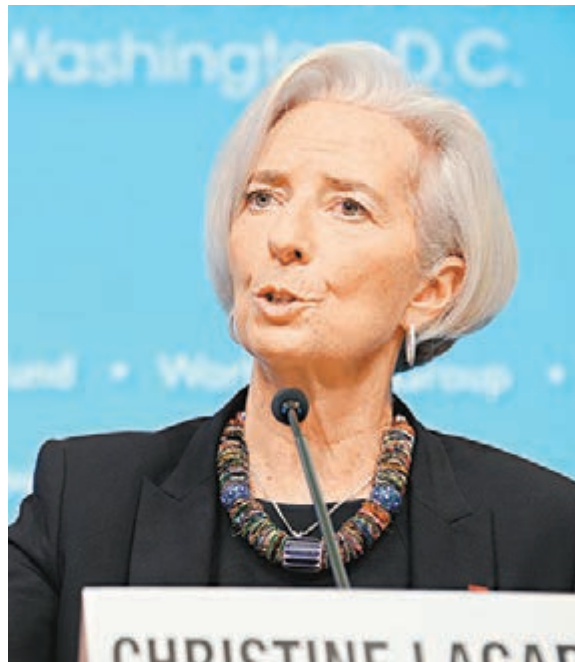
拉加德表示，中國沒有故意讓人民幣貶值，IMF歡迎人民幣國際化進程並認為這一進程將持續。 中新社

香港文匯報訊（記者 方楚茵）國際貨幣基金組織（IMF）總裁拉加德在華盛頓於當地時間10日盛讚中國對世界經濟增長的「關鍵作用」，她又不同意中國最近以人民幣貶值來促進經濟增長的說法，稱中國沒有故意讓人民幣貶值。