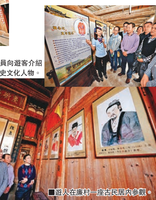
遊人在廉村一座古民居內參觀。