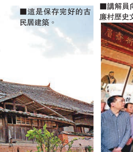
講解員向遊客介紹廉村歷史文化人物。