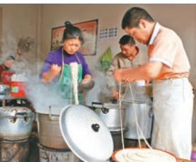
巍山小吃一根麵