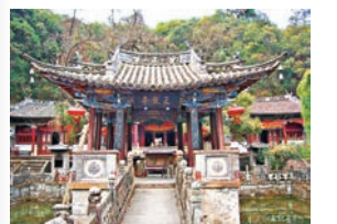
道教名山巍寶山古建築

扒肉餌絲、涼卷粉、蜜饯、鹹菜、米涼蝦、一根麵、餌塊、青豆米糕、南詔養生宴、測餌絲、湖菜、棠梨花粑粑……在巍山古城有着近百種小吃，每道小吃看似極其家常，卻都極不尋常。巍山小吃最大的特色是取材天然、純手工製作，講究色香味俱全，做法講究，樣式極其精緻。巍山人製作小吃從不為了售賣圖利跨過任何一道工序。即使巍山如今「小吃天堂」的名聲在外，吸引了眾多的吃貨前來，但巍山人還是遵循古輩的做法，沒有大規模的生產，全憑雙手能做多麼做多少。小吃中承載的可貴固執與淡然，可能也是當地小吃極其美味的原因之一吧！