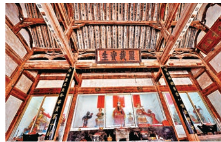
宗祠內供奉的祖先神像。