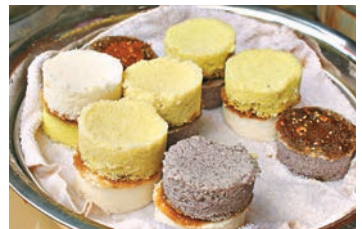
巍山小吃米糕