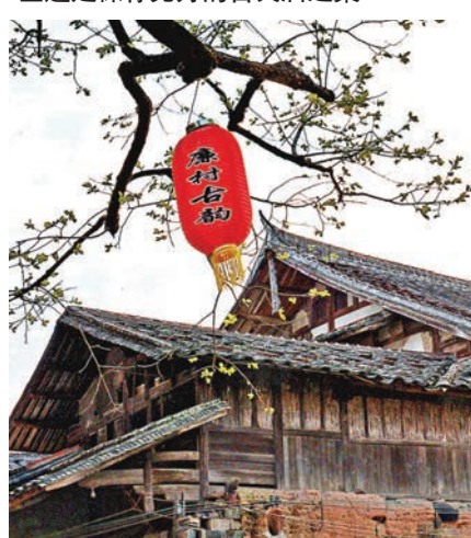
這是保存完好的古民居建築。