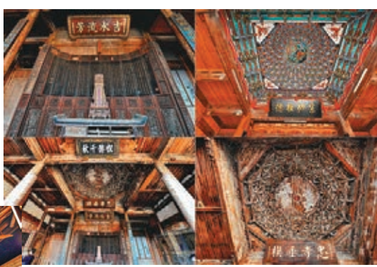
古民居內的屋內建築保存完好。

你聽過「廉村」嗎？原來在福建省有一廉村，名為福建廉村，2008年廉村更被國家住房和城鎮建設部、國家文物局授予第四批中國歷史文化名村。廉村原名石磯津，位於福建省福安市城區西南15公里處。唐朝時期，薛令之勤奮攻讀，成為八閩第一進士，並以其剛正不阿、清廉自好的品德受到唐肅宗嘉許，敕封他所在村為「廉村」，水為「廉水」，嶺為「廉嶺」。此後，廉村文化逐漸形成氛圍，從北宋大觀三年至南宋寶祐六年（1109—1258年）的150年間，廉村共出現17位進士。村中的古城堡、古官道、古民居以及宗祠、宮廟等古跡至今保留完好。