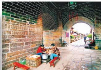
巍山古城小吃攤