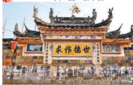
這是祠堂前的「照牆」。