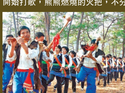
巍山彝族舞蹈打歌

農曆的六月二十四日，巍山還有更為熱烈的彝族傳統節日火把節，整個古城燃起火把，彝族同胞們開始打歌，熊熊燃燒的火把，不分晝夜地踏歌狂歡節日，處處洋溢彝族對生活的似火熱情。