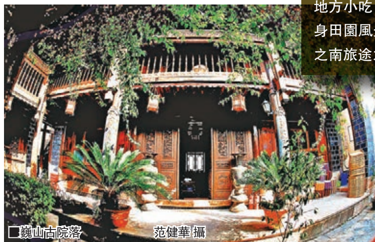
巍山古院落