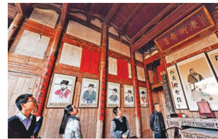
遊人在廉村一座古民居內參觀。