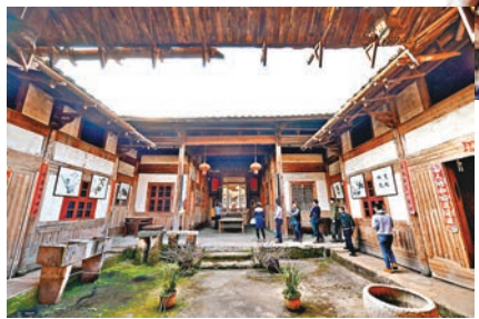
遊客在參觀古民居。