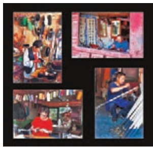
巍山古城店舖