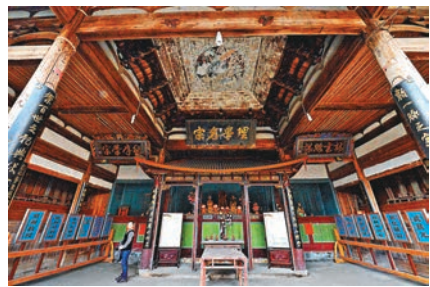
這是保存完好的古民居建築。