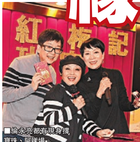
■倫永亮都有現身撐寶珠、阿喲場。

而今次和阿喲合作彼此默契增加，和全組人亦愈來愈合拍，已獲很多人讚好。那會否再與阿喲演其他戲？她卻謂完成澳門演出後，會休息1至2年才會再踏粵劇台板。又說：「大戲始終非我專長，就是因為今次口碑和反應好，下次更要演得好，是故非專業的我，便需更長時間準備和排戲。」