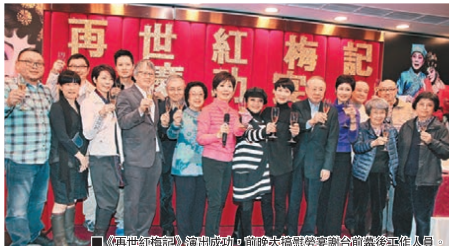
■《再世紅梅記》演出成功，前晚大搞慶功宴謝台前幕後工作人員。