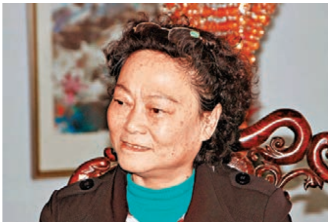
當代著名女詞人蔡長宜。