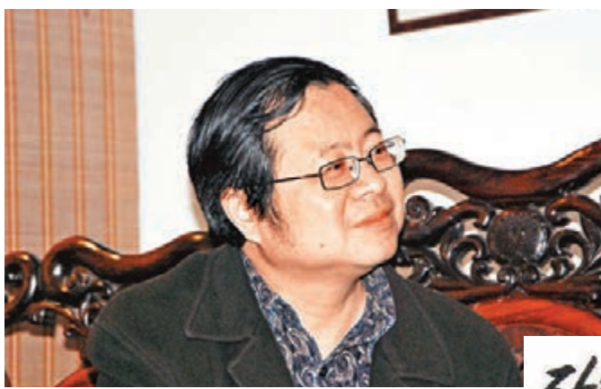
四川省書法協會副主席、成都市文聯副主席、成都市書法家協會主席、中國書法家協會首批會員舒炯。