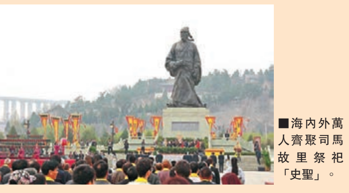
海內外萬人齊聚司馬故里祭祀「史聖」。

據介紹，本次大典祭祀儀軌經過王立群、彭林、閻純德等文化學者及專家共同研究確定，並建議將此儀軌作為民祭司馬遷的標準化祭祀儀軌。參加活動的專家學者們表示，「民祭」司馬遷作為中國三大祭祀品牌，有了「標準」儀式將更加有助於提升品牌的知名度。