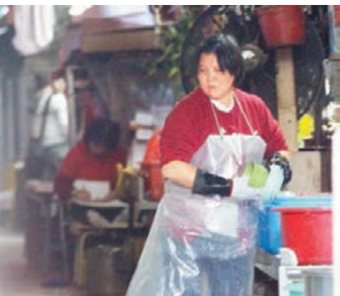
若將低資時薪水平上調至32元,當中以「物業管理、保安及清潔服務」加薪幅度最多,達5.3%。資料圖片

若將最低工資上調至部分工會要求的時薪35元水平,委員會推算涉及總薪酬開支將增加33億元,其中以「物業管理、保安及清潔服務」加薪幅度最多,達5.5%,涉及額外