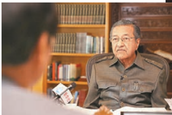
馬哈蒂爾接受新華社專訪，稱馬航事件不影響馬中關係。

馬哈蒂爾現年88歲，1981年起任馬來西亞總理，至2003年辭任，在任時間長達22年，是馬來西亞獨立以來任職時間最長的政府領導人。馬哈蒂爾多年來為推進中馬友好合作作出了重要貢獻，國家主席習近平稱他為中國人民敬重的老朋友。