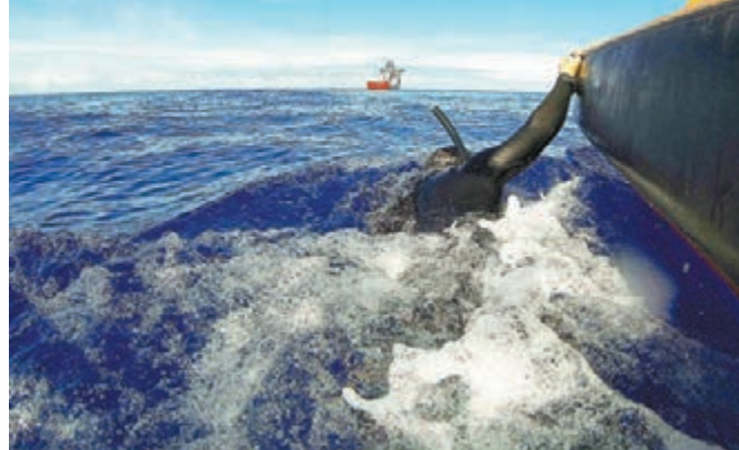
澳方潛水員昨日下午下水搜尋馬航碎片。

澳洲聯合協調中心還稱，昨日有14架飛機和14艘艦船參與搜尋行動。澳海軍安全局當天在南印度洋上位於珀斯西北方向2,268公里處選定一塊77,580平方公里的目標海域集中搜尋。澳洲國防部長約翰遜昨日在珀斯表示，飛機及艦船正全力以赴參與這場「極為艱巨」的搜尋行動，「這樣的密集搜尋行動至少還需持續一些日子」。