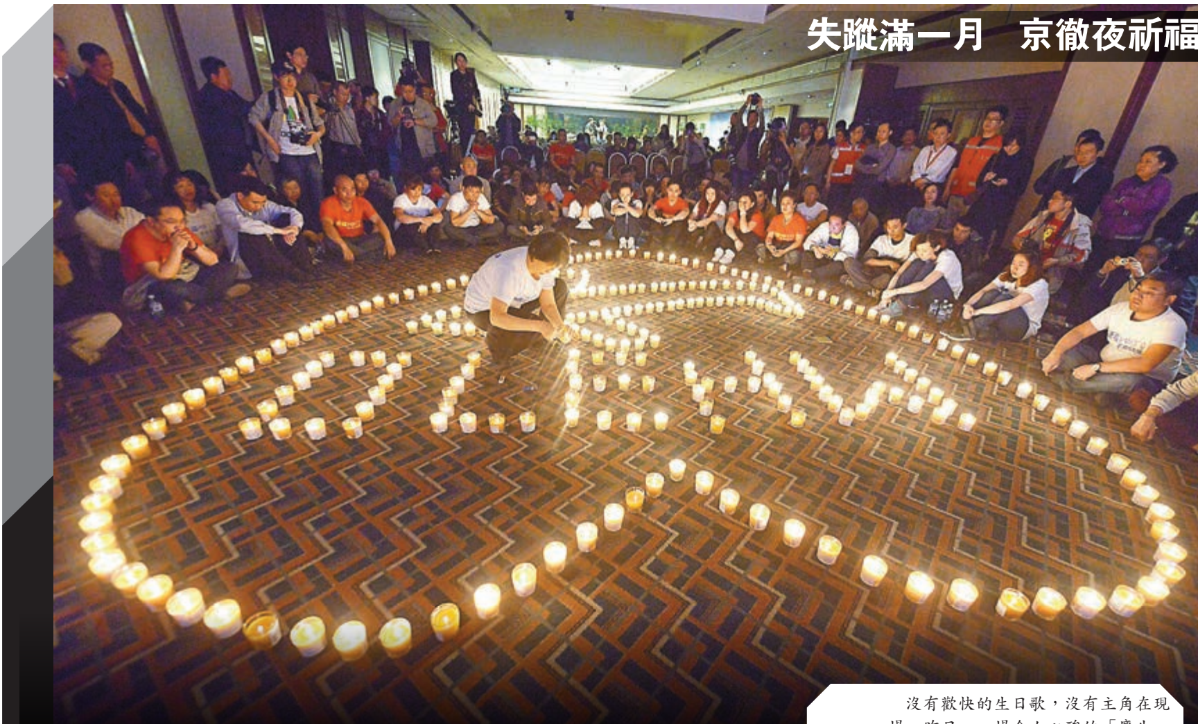
失蹤滿一月 京徹夜祈福