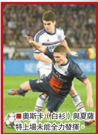
奧斯卡(白衫)與夏薩特止場未能全力發揮。