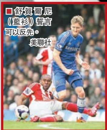
舒賀爾尼(藍衫)誓言可以反先。