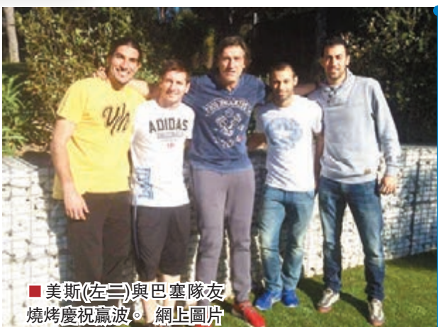
美斯(左三)與巴塞隊友燒烤慶祝贏波。