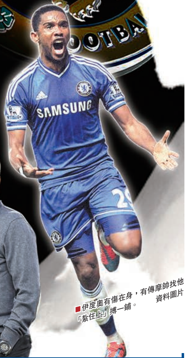
伊度奧有傷在身，有傳摩帥找他「紮住上」搏一鋪。