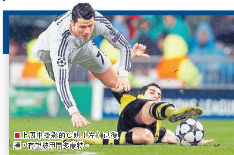
上週中掛彩的C朗(左)已復操，有望披甲鬥多蒙特。