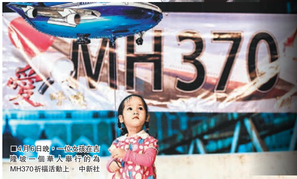
4月6日晚，一位女孩在吉隆坡一個華人舉行的為MH370祈福活動上。