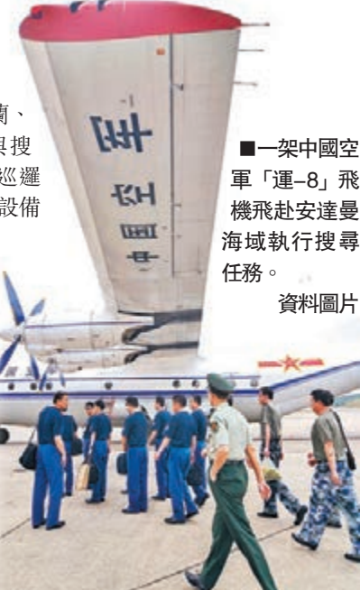
一架中國空軍「運-8」飛機飛赴安達曼海執行搜尋任務。資料圖片

中國海軍是此次搜尋行動中派遣水面艦隻規模最大的隊伍，先後派出2艘071型兩棲船塢登陸艦、1艘052C型導彈驅逐艦、1艘054A型導彈護衛艦、1艘補給艦及4架艦載直升機。美國海軍第七艦隊則先後派出導彈驅逐艦「平克尼號」和「基德號」導彈驅逐艦參與救援。兩艘軍艦屬於美國阿利伯克級驅逐艦家族，配備宙斯盾戰鬥系統，是美國現役最先進的驅逐艦。