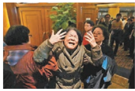
3月24日 馬稱墜機 家屬崩潰