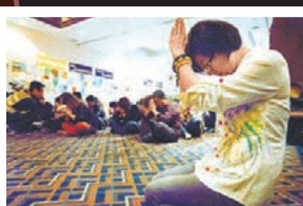
4月4日 堅信未死 家屬祈福