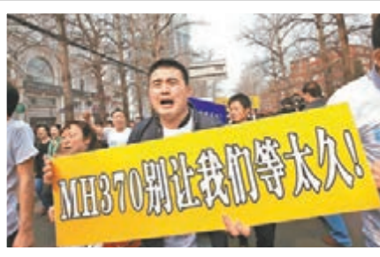
3月25日 家屬上街 抗議大馬