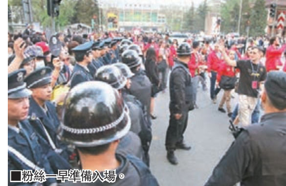
粉絲一早準備入場。