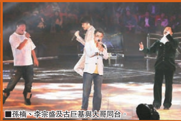
孫楠、李宗盛及古巨基與大哥同台。