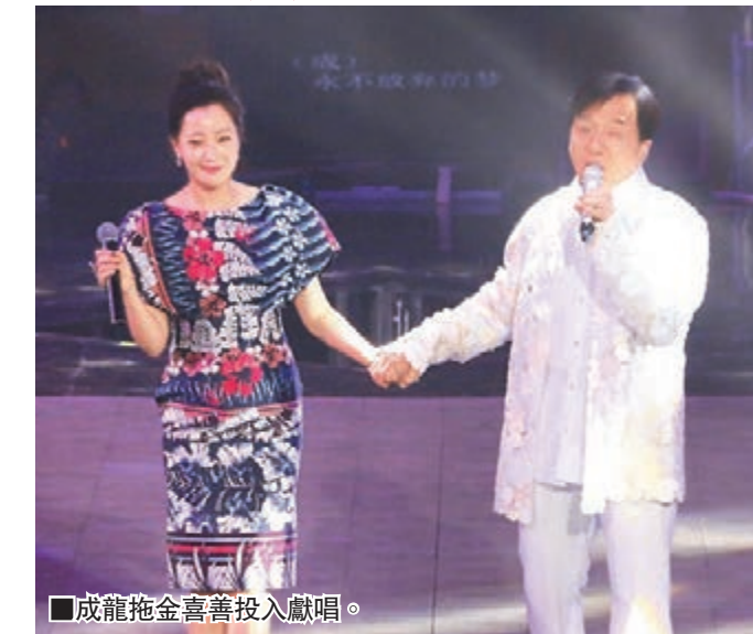
成龍拖金喜善投入獻唱。

香港文匯報訊(記者 李慶全)影壇大哥成龍今年60大壽，在這特別日子，大哥安排了一連串有意義活動，昨晚在北京工人體育館舉行的慈善活動「和平友愛演唱會」，邀得一眾亞洲嘉賓演出，包括韓國代表EXO、金喜善、JJCC，日本代表米希亞(Misia)，新加坡代表蔡淳佳、內地代表孫楠、郎朗，台灣代表李宗盛、王力宏、周杰倫、張韶涵及香港代表李玟、謝霆鋒和房祖名。現場一萬個座位全部坐滿，有50幾個國家的粉絲專門到京賀偶像牛一，成龍甫出場即用多國語言以「好朋友」和「好兄弟」向現場觀眾打招呼。