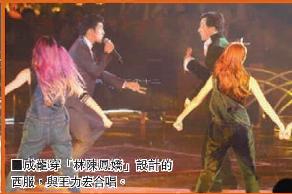
成龍穿「林陳鳳嬌」設計的西服，與王力宏合唱。