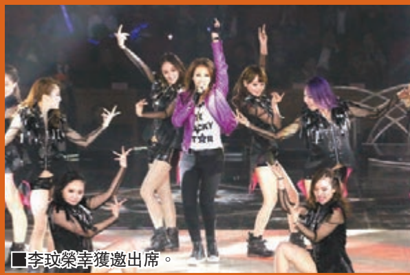
李玟榮幸獲邀出席。