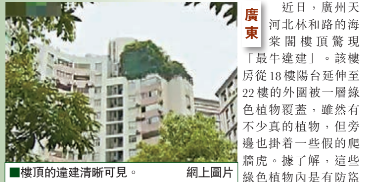
樓頂的違建清晰可見。網上圖片

近日，廣州天河河北林和路的天棠閣樓頂發現「最牛違建」。該樓房從18樓陽台延伸至22樓的外圍被一層綠色植物覆蓋，雖然有不少真的植物，但旁邊也掛着一些假的爬牆虎。據了解，這些綠色植物內是有防盜網的。在19樓的樓梯窗戶旁裝了一扇門，但敲門沒人答應。專家稱這樣有可能導致該樓宇的樓板拉裂或扯裂，輕則是樓下垂直的幾套單位的結構受損，嚴重的話將會影響整棟樓宇的結構。