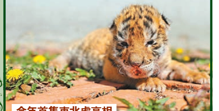
今年首隻東北虎亮相

4月6日，瀋陽怪坡東北虎園，一隻剛出生10天的小東北虎在地上慢爬，天真賣萌的表情惹人喜愛，這是今年虎園生下的首隻東北虎。