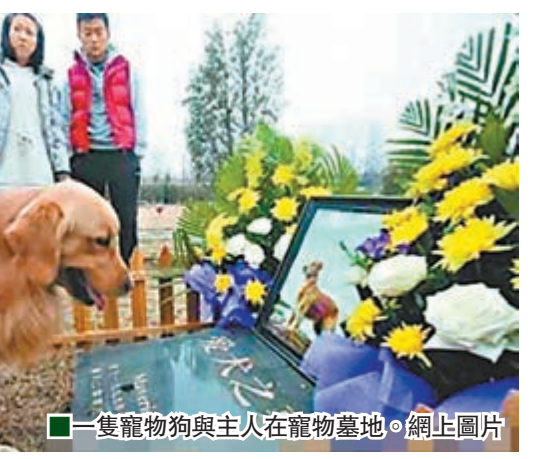
一隻寵物狗與主人在寵物墓地。網上圖片