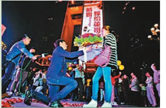
求婚大作現場。

重慶 前日晚8點，重慶南濱路喜來登國際金融中心外牆巨型LED大屏幕上，突然出現一則求婚廣告：晴姐，嫁給我吧哥。……在LED大屏幕對面的南濱公園裡，一男子手捧鮮花，單膝跪在地上，向心愛的女友求婚。