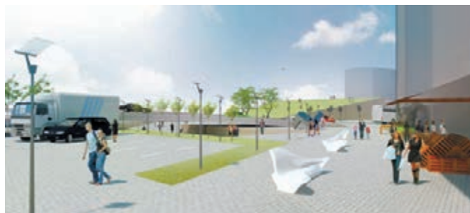
大埔廣福橋一帶活化後預想圖。