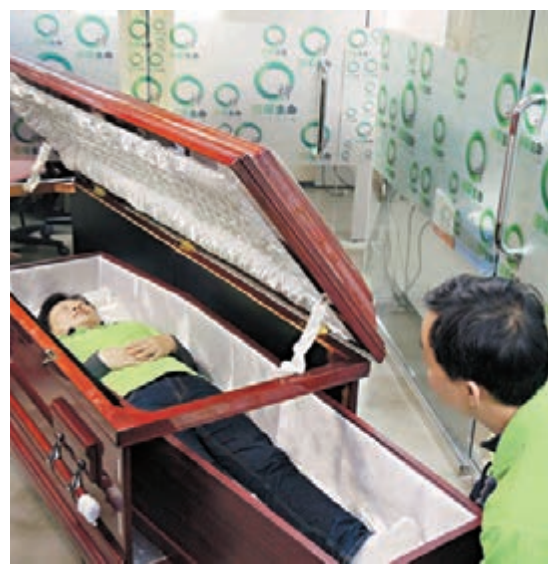
瞻仰遺容時，「內槨」會放在「外槨」中，直到火化前才從「外槨」兩端取出。

香港文匯報訊（記者 陳廣盛）政府推廣俗稱「紙棺材」的環保棺材至今已近10年，但其外形一直被形容爲「似足鞋盒」，瞻仰遺容時不夠體面，故一直乏人問津。有殯儀業界人士更表示，2012年全港使用約2,000副「紙棺材」，只佔當年死亡總人數約5%。有見及此，社會企業「環保生命」推出全港首副可循環再用棺材，作爲「紙棺材」「外槨」，讓孝子賢孫支持環保之餘不失體面，從而鼓勵更多人爲先人選用「紙棺材」，減少砍伐樹木。