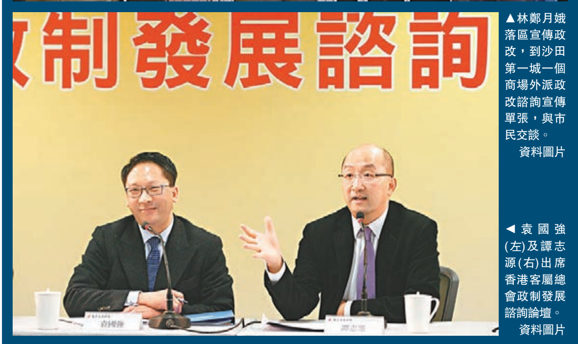
▲林鄭月娥落區宣傳政改，到沙田第一城一個商場外派政改諮詢宣傳單張，與市民交談。資料圖片