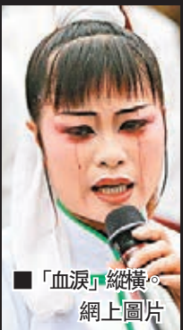
「血淚」縱橫。網上圖片

內地民間很早就有職業哭靈人這一行當。近日，網絡流傳一組福建職業哭靈女的照片，她們每月「哭」二十多場，每場收入三千元，收入比白領更可觀。每哭完一場，她們都需要放鬆情緒，可謂人前哭完人後笑。