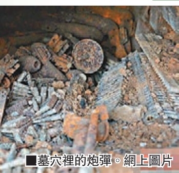
墓穴裡的炮彈。

上月31日，河南新縣周河鄉付沖村村民韓某掃墓時，突然發現附近的墳山鬆動，墓磚坍塌。他上前仔細查看，發現墓內都是「鐵疙瘩」，好像是武器彈藥。相關人員觀察後發現，墓內確有炮彈、槍械、子彈等武器。有關部門推測，這批隱藏的武器彈藥是劉鄧大軍戰略轉移所留下的。經過發掘，古墓內的武器彈藥全部出土，有迫擊炮發射裝置2套，炮彈共84枚，子彈6,475發。1947年，劉鄧大軍千里躍進大別山，在當地也和國民黨軍隊發生過激烈戰鬥。