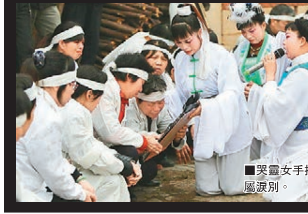
哭靈女手捧遺像與親屬淚別。網上圖片