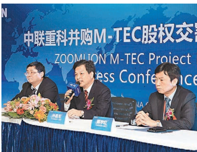
中聯重科公司高層介紹併購M-TEC股權交割。

此次併購正是基於對行業升級轉型方向和未來市場前景的預估和判斷。他樂觀表示，「計劃很快將收回投資（成本）並為公司提供一個新的盈利增長點」。他指「併購後，借由德國頂尖技術品質，完善的全球產業鏈與銷售服務