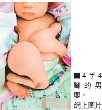
4手4腳的男嬰。

本月2日，一名男嬰在廣東惠州市惠東縣出生，令人驚訝的是，這名男嬰竟然多了一隻手和一隻腳。嬰兒父親陳先生說，可能是孩子媽媽剛懷孕的時候，有吃過藥、打過針。因為家庭條件不好，此前也沒有做過詳細檢查，沒有照過B超。經檢查，小孩屬於非對稱性連體畸形，還要等進一步的檢查，再確定手術方案。