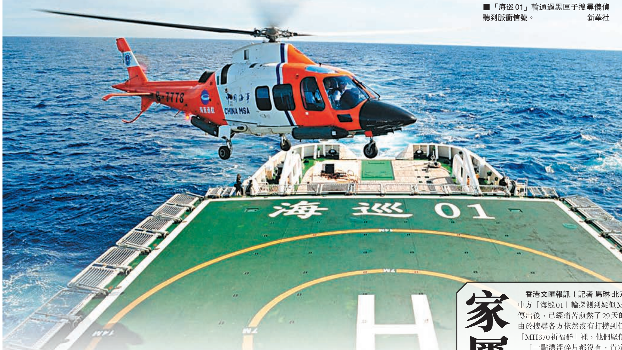
■「海巡01」輪通過黑匣子搜尋儀偵聽到脈衝信號。