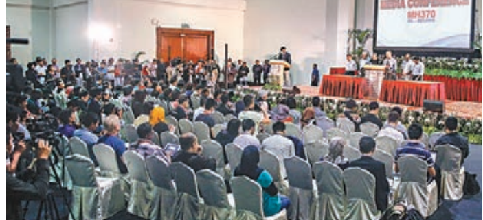
■馬來西亞政府在吉隆坡舉行新聞發佈會。