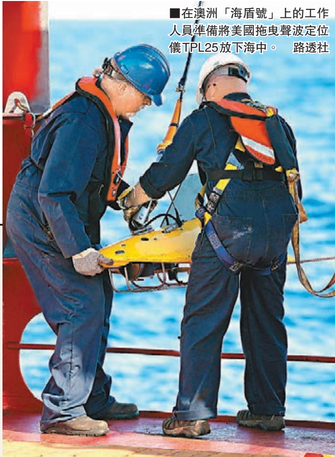
■在澳洲「海盾號」上的工作人員準備將美國拖曳聲波定位儀TPL25放下海中。

美國拖曳聲波定位儀TPL25和「金槍魚」自動水下航行器。TPL25需由一艘航速1至5節（註：1節約為每小時1.8公里）的航行器拖曳，因此搜索進程會很慢。據澳洲方面消息，昨日共有11架軍機、4架民用機和11艘船隻參與搜尋工作，搜尋水域位於珀斯西北方向1,700公里處，面積21.7萬平方公里。澳方將根據數據分析不斷調整搜尋區域。有媒體報道，一支新的訓練有素的澳空中觀察員隊伍也將加入到MH370搜索工作中。該隊伍包含4名空中觀察員，他們曾參與過機載海上和偏遠地區的搜索。