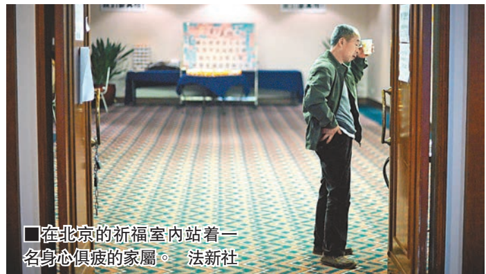
■在北京的祈福室內站著一名身心俱疲的家屬。

香港文匯報訊（記者 馬琳 北京報道）「不是，肯定不是。」當中方「海巡01」輪探測到疑似MH370航班黑匣子脈衝信號的消息傳出後，已經痛苦煎熬了29天的乘客家屬們不願相信這一消息。由於搜尋各方依然沒有打撈到任何飛機殘骸，在由家屬們建立的「MH370祈福群」裡，他們堅信「親人們都活着」。「一點漂浮碎片都沒有，肯定不會是真的。」有乘客家屬分析稱，「因為飛機落深海必解體，解體必有成百上千漂浮物，現在漂浮物沒有，怎麼會是飛機在海裡？沒道理！」在近一個月的等待中，各種發現後又闢謠的消息，已經讓乘客家屬們對一切都本能的懷疑。「這可能是一場惡作劇」，另一位乘客家屬表示。馬方提出的飛機遭劫持的說法，一直讓家屬們堅信親人只是暫時失去了自由，一旦與劫匪談判成功，親人們回家的那一刻就會到來。面對黑匣子脈衝信號被探測到的消息，一位乘客家屬稱，「我堅信人和飛機早就分開了，除非飛機裡找到人，否則我什麼都不信！」