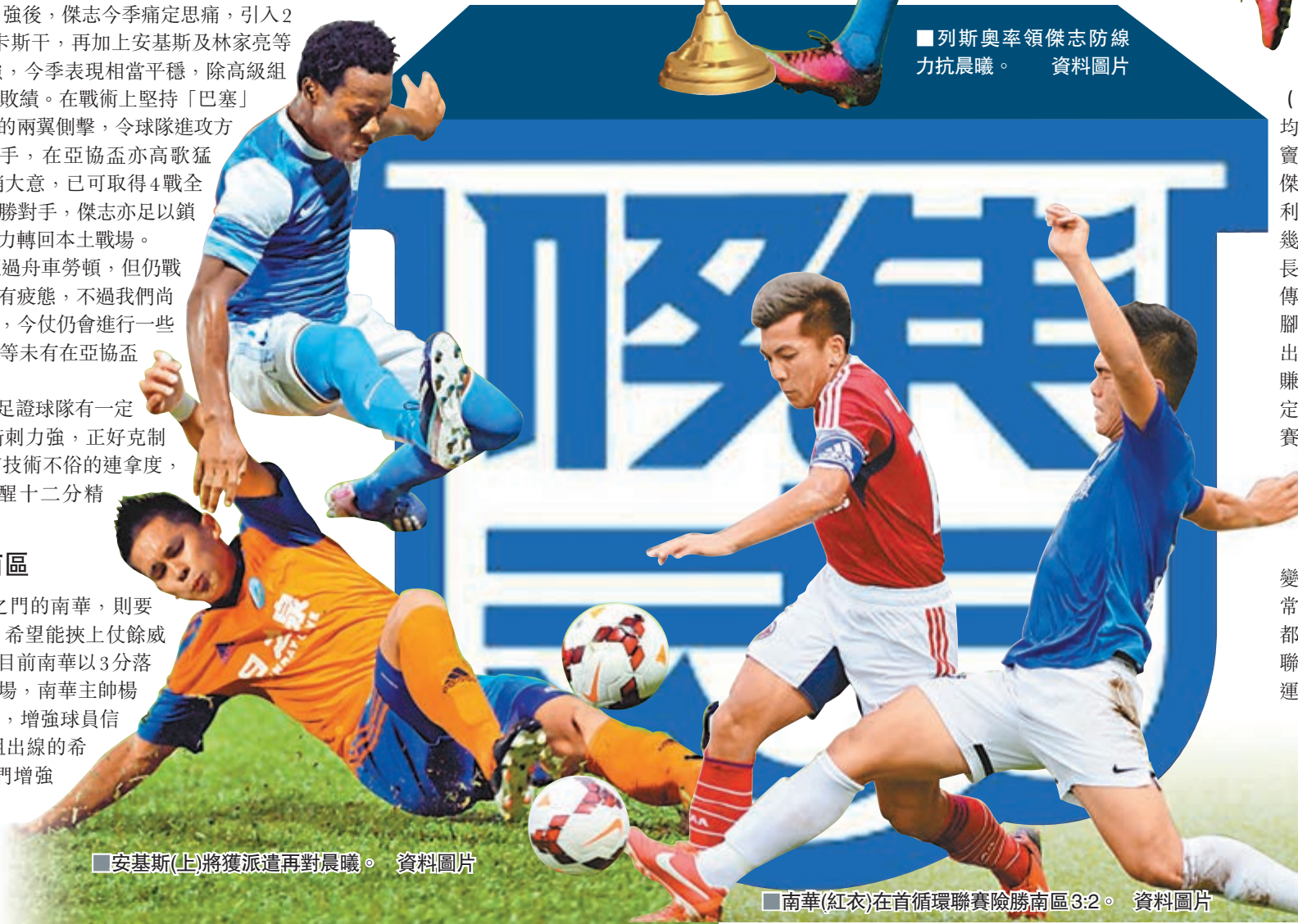
■安基斯(上)將獲派遣再對晨曦。 資料圖片