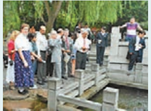
■圖為外國友人參觀趵突泉公園。 資料圖片

香港文匯報訊（記者 殷江宏 山東報道）相對於出境遊的火爆行情，去年內地入境遊客數量出現小幅下降，其中旅遊大省山東入境旅遊人數同比下降3.66%。山東省旅遊局副巡視員周曉明在接受本報採訪時表示，今年山東將繼續加大在海外的營銷力度，包括借助「好客山東」香港旅遊營銷中心加強宣傳推廣。