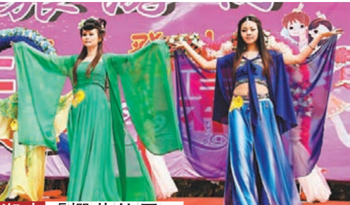
湖南「櫻花仙子」參加海選的「櫻花仙子」昨日在湖南洪江古商城境內的嵩雲山進行才藝比拚。當日，湖南洪江古商城「櫻花浪漫季」活動正式拉開序幕。「櫻花仙子」的出現吸引了數千名遊客的圍觀。

香港文匯報（實習記者 馮芳慧 內蒙古報道）內蒙古財政廳近日表示，2014年新型農村牧區合作醫療除中央補助外，內蒙古各級財政補助100元，標準提高到每人每年320元。政策範圍內住院報銷比例不低於75%，實際住院報銷比例繼續提高，門診報銷比例達到50%以上。另外，對人口在6萬人以下的牧業旗縣，每人每年增加補助20元。本次下達資金為自治區級財政補助資金，按應補助資金的80%撥付。