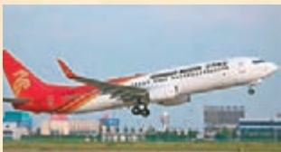
■航班從成都雙流機場起飛莫斯科國際航線，將在今飛。

香港文匯報訊（記者 劉銳 成都報道）繼美聯航去年宣佈計劃於今年開通成都直飛三藩市航線後，記者近日從四川省成都雙流機場獲悉，中西部地區首條成都直飛莫斯科國際航線，將在今飛。