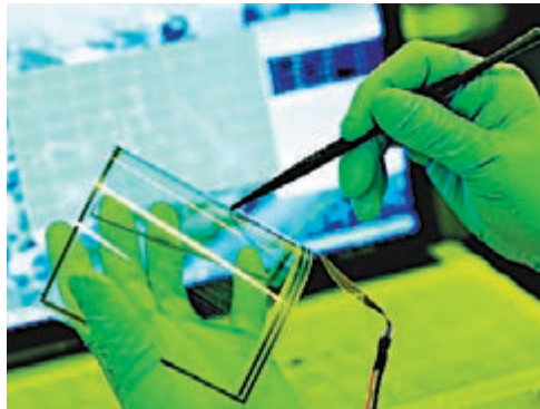
■一研究人員在彎曲的單層石墨烯觸摸屏上測試書寫功能。

香港文匯報訊（實習記者 張馨月 重慶報道）重慶企業計劃於年內推出可折疊手機樣機，3至5年內有望批量應用。這種注入石墨烯「元素」的新型手機，外觀看起來不僅較現有的智能手機更薄，還可以實現彎曲折疊。