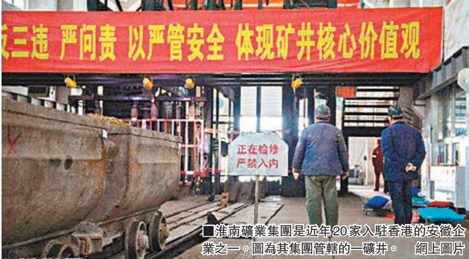
■淮南礦業集團是近年20家入駐香港的安徽企業之一。圖為其集團管轄的一礦井。

香港文匯報訊（記者 張玲傑 合肥報道）安徽省合肥市近日舉行香港特區投資推廣署研討會，對香港的營商環境、區位優勢、稅務政策等做出推介，鼓勵內地企業以香港作為有利平台「走出去」，從而在融資、法律、會計、品牌打造等方面配合皖企的發展需要，拓展海外市場。