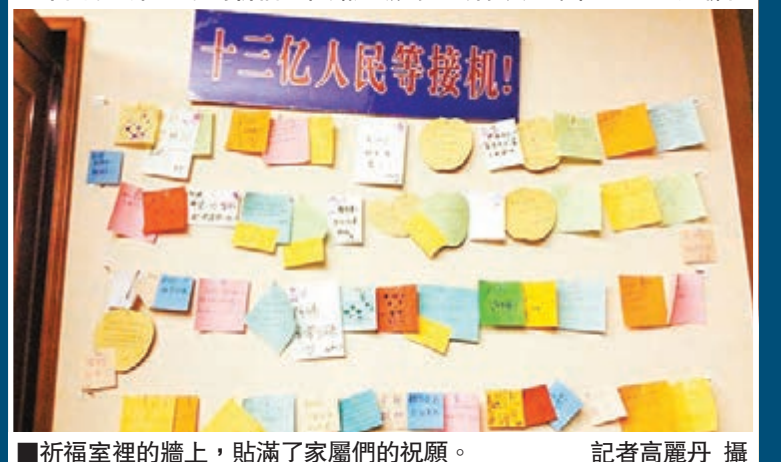
■祈福室裡的牆上，貼滿了家屬們的祝願。