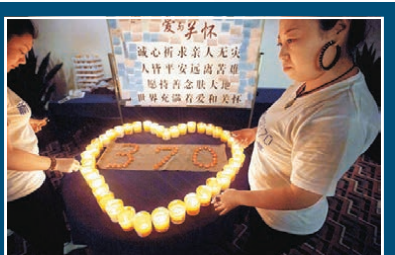
■中國家屬在北京的祈福室裡點起蠟燭，期待親人歸來。

香港文匯報訊（記者 馬靜 北京報道）今天是清明節，每逢清明倍思親，然而，對於失蹤馬航中國家屬而言，這個清明更是倍難熬。因為直到今日，他們的親人依然生死未卜，儘管一切信息都不容樂觀，但是他們堅信，親人依然活着，因此，家屬堅稱「清明節，跟我們無關」，他們已有心理準備，作出長期等待。