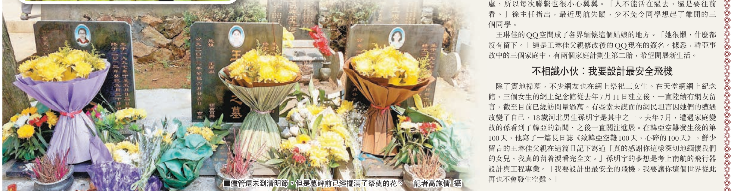
■儘管還未到清明節，但是墓碑前已經擺滿了祭奠的花。