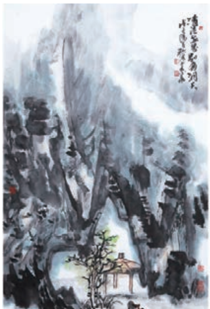
《清涼世界，別有洞天》