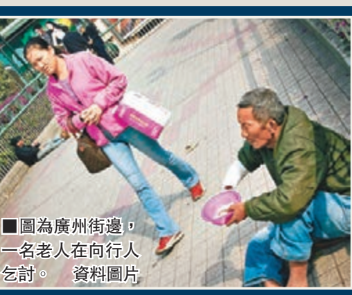
■圖為廣州街邊，一名老人在向行人乞討。資料圖片