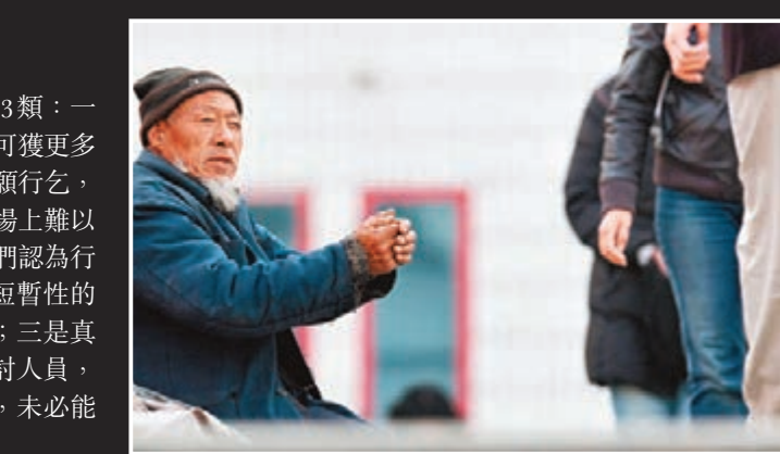
■貧富差距是中國經濟發展中關鍵問題。圖為北京街頭一名老乞丐在乞討。

乞討人員可以分為以下3類：一是有能力工作但認為行乞可獲更多收入的人士，他們自然寧願行乞，不願接受救助；二是在市場上難以找到工作的失業人員，他們認為行乞是其維持生計的方法，所以即使接受短暫性的救助，他們也可能很快便「重操故業」；三是真的需要協助，但是無能力表達意思的乞討人員，尤其是殘疾人士。他們受到監視、看管，未必能與救助人員明確表達意願等。