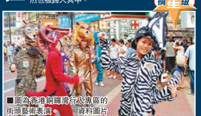
■圖為香港銅鑼灣行人專區的街頭藝術表演。

近年以來，香港人流密集的地區如銅鑼灣、旺角等出現了一批街頭表演者，其表演為行人提供娛樂，也增加了香港的藝術氣息。但是在香港，街頭表演一向是個灰色地帶，並無特定法例支持或禁止。「反行乞」條例，如果在街上又表演又拿錢，就是行乞，街頭藝術自然也被歸入其中。