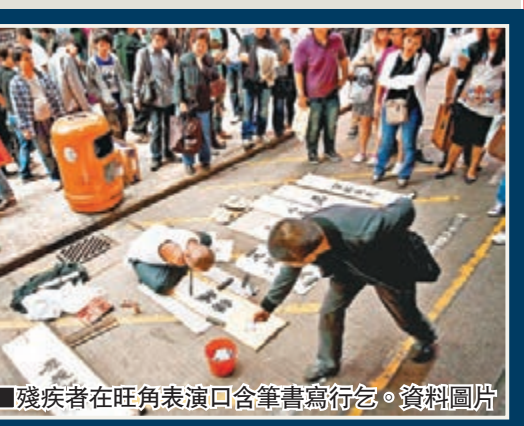
■殘疾者在旺角表演口含筆書寫行乞。