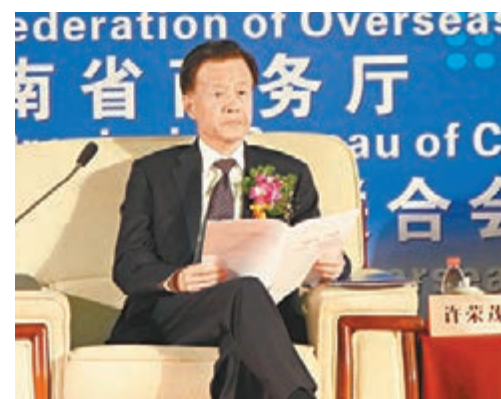
■許榮茂出席第八屆投洽會中國(河南)——東盟僑商貿易投資對接活動。

香港文匯報訊(記者 朱利、魏靜磊 鄭州報道)全國政協經濟委員會副主任、中國僑聯副主席、中國僑商聯合會會長、世茂集團董事局主席許榮茂2日出席第八屆投洽會中國(河南)——東盟僑商貿易投資對接活動時說,河南迎來了新的發展機遇,而東盟則站在了新的歷史起點上。他寄語東盟牽手河南優勢互補,合作共贏。