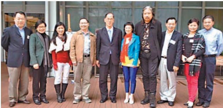
■中華文化總會副會長林煒(左六)等與曾德成(左五)、許曉暉(左二)合影。

香港文匯報訊(記者 子京)民政事務局長曾德成、副局長許曉暉日前與香港中華文化總會代表會面,聽取該會對香港文化發展政策和深入推廣中華文化等方面的意見。文化總會認為,中華文化是香港文化的根,香港回歸祖國近17年了,特區政府應加大力度推廣中華文化,在政策方面予以更多支持配合,加快推動文化回歸,以促進人心回歸。