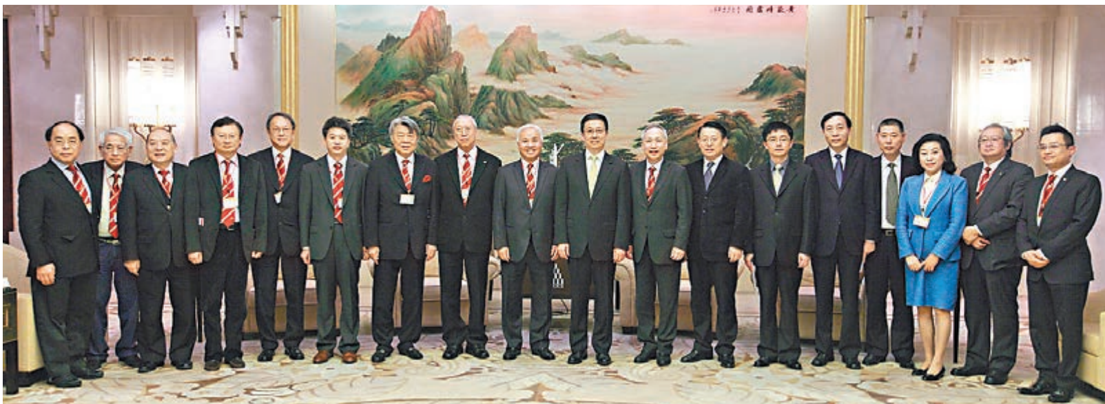
■韓正書記(右九)與中總考察團部分成員合影。

香港文匯報訊(記者 子京)中華總商會日前組團赴上海考察訪問,獲中央政治局委員、上海市委書記韓正會見,考察團並拜訪上海自貿試驗區管委會等。韓正對中總多年來為促進滬港緊密合作所付出的努力表示肯定,歡迎香港企業家共同參與上海自貿區的建設。