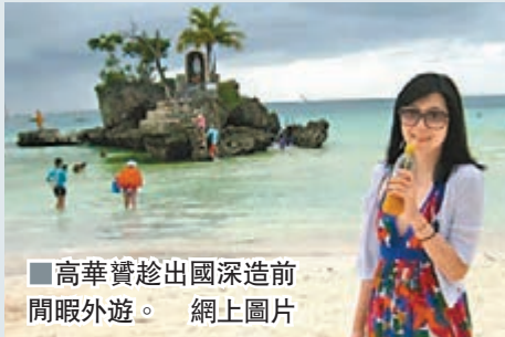
■高華實趁出國深造前開眼外遊。