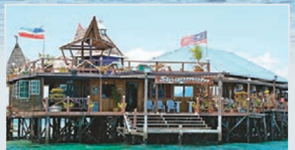
■事發地點新佳馬達（Singamata）海上度假村正門。

香港文匯報訊 沙巴警方昨日舉行新聞發布會表示，不排除部分綁匪是本地人，而且對該度假村非常的熟悉，警方相信綁架案是有內鬼裡應外合，並已掌握一些可靠線索，以揪出內鬼，並將與菲律賓的同僚合作。