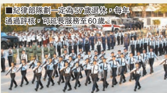
■紀律部隊劃一定為57歲退休，每年通過評核，可延長服務至60歲。

問及當局有否評估延長公務員退休年齡所構成的額外公帑開支，發言人承認公務員年資愈長，公積金供款額自然愈大，但沒有計算當中牽涉多少公帑，又稱相信不用到立法會修例。但當記者進一步