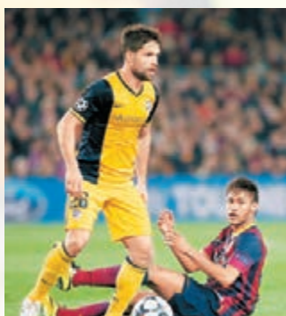
迪亞高（左）同尼馬（右）兩巴西兵一人一粒。