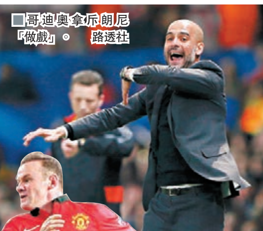
哥迪奧拿斥朗尼「做戲」。