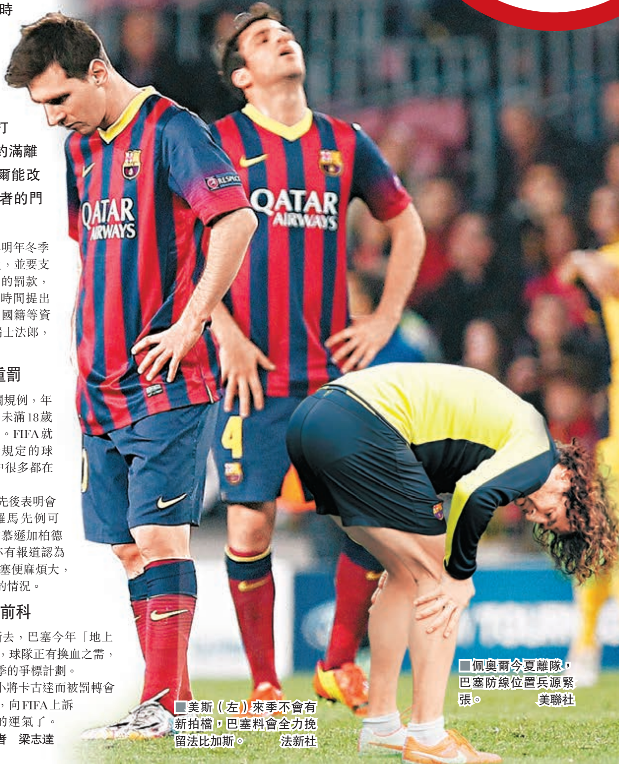
佩爾今夏離隊，巴塞防線位置兵源緊張。