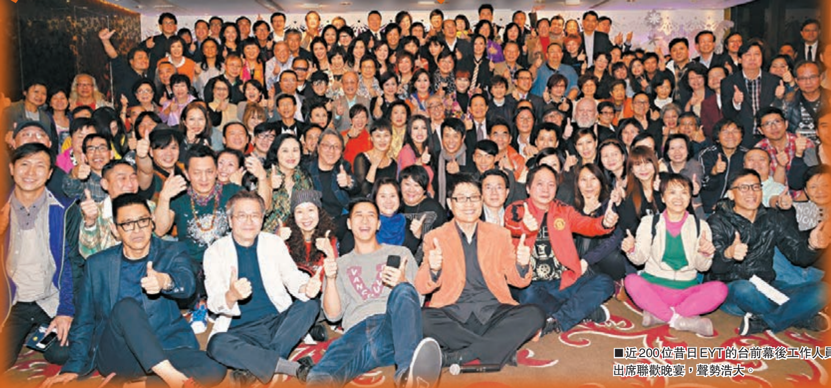
近200位昔日EYT的台前幕後工作人員出席聯歡晚宴，聲勢浩大。