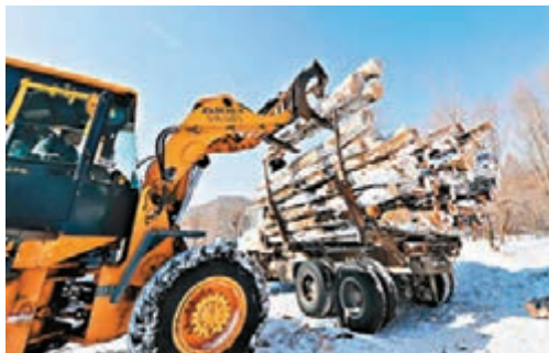
■森林中木材裝運出山的情況。

香港文匯報訊(記者 孫菲 哈爾濱報導)昨日起黑龍江省森工和大興安嶺森工兩大國有重點林區全面停止商業性採伐,這預示着內地最大的國有林區正式啟動休養生息時間表。19件建國後林業各時期的採伐工具,也自此永久性入駐黑龍江省博物館。