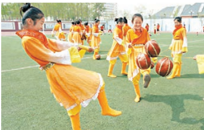
山東蹴鞠舞 山東省淄博市臨淄區晏嬰小學部分學生昨日練習蹴鞠舞。蹴鞠是古代清明時節的一項傳統習俗。近年在蹴鞠的起源地淄博臨淄,人們將蹴鞠文化引入校園,讓孩子在快樂運動中,感受傳統文化的魅力。

香港文匯報訊(記者 王尚勇、蔣金鵬 銀川報導)寧夏交通運輸廳今年將投資2.7億元,用於實施區內道路沿線綠化工程。其中:投資1.06億元用於高速公路中央分隔帶和普通國省幹線路側行道樹綠化工程;投資7571萬元,對全區17對高速公路服務區進行綠化;投資8757萬元,對全區共78個高速公路匝道及立交區實施綠化工程。寧夏今年投資2.7億元的大綠化工程,是該項工程的第三階段,目前工程已全面鋪開預計5月底結束。