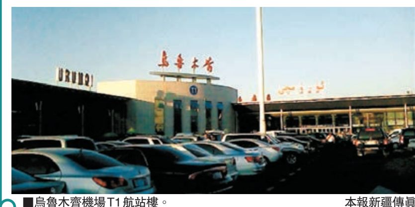
■烏魯木齊機場T1航站樓。

香港文匯報訊(實習記者 王辛鵬 新疆報導)本月1日零時起,關閉3年的新疆烏魯木齊地窩堡國際機場T1航站樓重新啟用。自此,天津航空、首都航空、春秋航空、雲南祥鵬航空、中國聯合航空、奧凱航空和西部航空等7家航空公司,將從T2航站樓轉場到T1航站樓運營。參考2013年這7家航空公司運送旅客數據,重新啟用的T1航站樓預計年分流200多萬人次。另據新疆機場集團發佈的數據,2013年烏魯木齊地窩堡國際機場旅客吞吐量達到1536萬人次,比上年增長15.1%,超過了南京祿口機場,旅客吞吐量排名在全國機場位居14位。