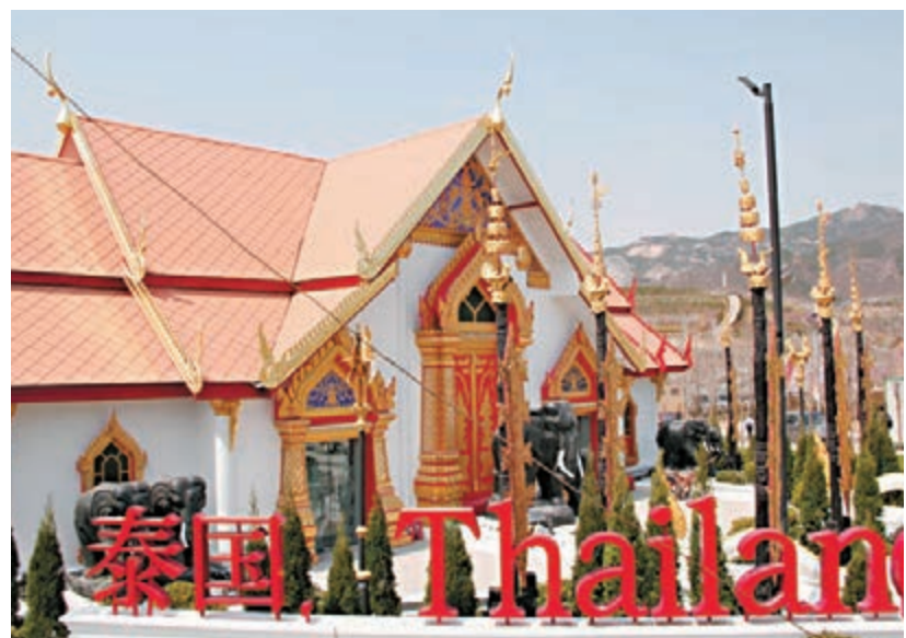
■青島世園會內泰國主題園藝。

香港文匯報訊(記者 許桂麗、王宇軒、張勇 青島報導)昨日2014青島世園會執委會向公眾公佈相關園區規劃設計。青島世園會是中共十八大之後中國舉辦的第一個國際性的園藝博覽會,是展示世界各國園藝精品和科技成果的最高級別專業性國際博覽會。據了解,園區結合水庫、河流、山地、森林等自然空間要素,形成「兩軸(三區)十二園」的總體空間結構。