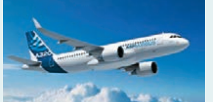
■同款的空巴A320neo飛機。

空巴天津總裝線合作各方正式確認了總裝線二期合作計劃。空巴天津總裝線是空巴公司與天津保稅區和中國航空工業集團公司共同建設的合資企業,空巴天津總裝線二期合作計劃涵蓋的時間段為2016至2025年。在二期合作計劃中,空巴天津總裝線將增加空巴A320neo的總裝,空巴公司還將繼續支持配套零部件供應商落戶天津,支持當地航空產業發展。空巴公司在發佈會上亦宣佈推廣天津成為空巴在亞洲的中心。