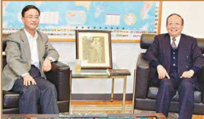
楊瀚與中國國民黨副主席蔣孝嚴。本報北京傳真