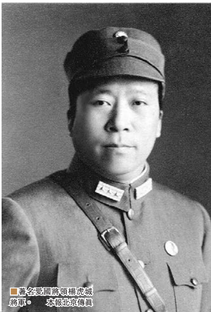
著名愛國將領楊虎城將軍。

楊瀚此前曾多次往返海峽兩岸，對西安事變、抗日戰爭展開學術研究。今年5月，楊瀚將再赴台灣推動兩岸於明年共同紀念抗戰勝利70周年，他並強調對抗戰的研究要有新高度，「我們應站在國家、民族的角度看待抗日戰爭。而不是站在黨派的角度上。」楊瀚說，他研究這段歷史就是為了讓民眾認識抗日戰爭真正的意義，以史為鑒。