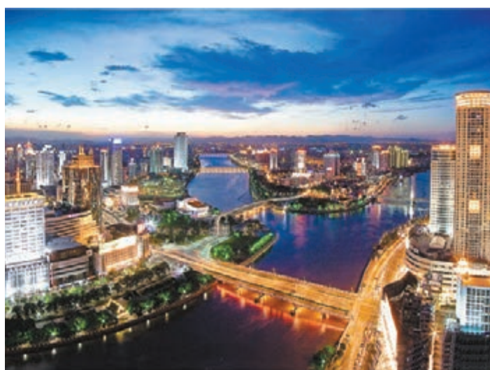
寧波市三江口繁華的夜景。本報浙江傳真