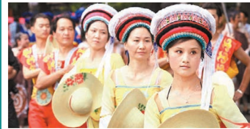
大理白族文化燦爛,歷史悠久。圖為白族女性穿上民族服飾在表演。本報雲南傳真

香港文匯報訊(記者王晉 昆明報道)為展示歷史悠久、豐富多彩的大理白族文化,以「幸福大理·魅力白州」為主題的「北京·大理白族文化周」將於4月12日至18日在北京民族文化宮舉辦。大理是中國唯一的白族自治州,集內地歷史文化名城、國家級風景名勝區及國家級自然保護區等多項桂冠於一身。近年大理州依托民族文化,推進旅遊業快速發展。據了解「北京·大理白族文化周」活動內容豐富,包括書畫攝影展、白族服飾展、工藝美術品和非物質文化遺產展示、旅遊宣傳推介、白族民居建築和房地產推介、民族團結和繁榮進步進,文化周舉行期間,還將進行白族歌舞表演、中國白族村落影像文化叢書發行、文藝作品展示以及電影、微電影展播等活動。