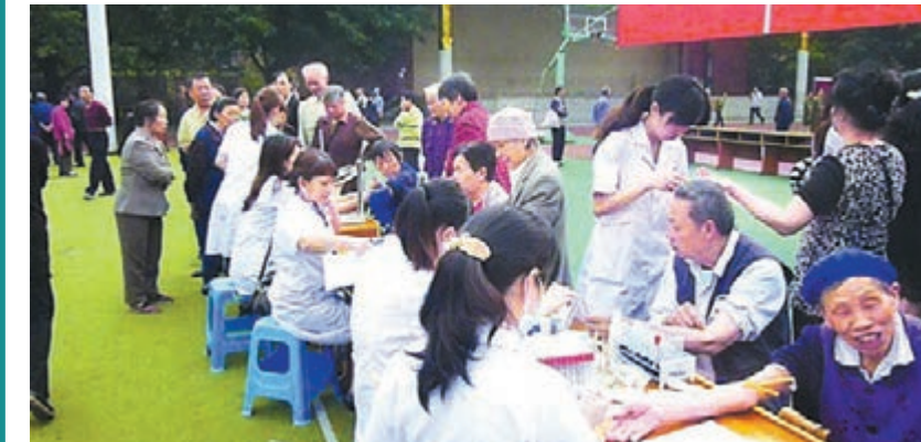
重慶完善醫患糾紛第三方調解和醫療責任保險機制。本報重慶傳真

香港文匯報訊(記者袁巧 重慶報道)為加強醫院投訴管理和醫患溝通,完善醫療糾紛人民調解工作,重慶市將制定出台《重慶市醫患糾紛預防與處置辦法》,並在二級以上公立醫療機構建立醫療責任險,探索建立醫療意外險和醫療風險金,以完善醫療風險分擔機制。「不過,醫院本身的醫療安全也要保證。」重慶市衛計委有關負責人稱,重慶將探索建立醫療安全事件監測、預警和評價體系,建立重大醫療糾紛、重大醫療過失及重大醫療不良事件內部通報制度。此外,重慶還將研究建立醫療機構與養老機構之間的業務協作機制,實現二級以上醫院與老年病院、老年護理院、康復養老機構之間的轉診與合作,並在部分區縣開展護理服務模式試點,讓醫療機構護理服務延伸至家庭和社區。