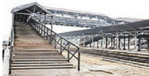
天津北站現今仍保存完好的鋼木結構的天橋。

香港文匯報訊(記者李欣 天津報道)鐵路部門透露消息,今日起有111年歷史的天津北站將陸續停止辦理客運業務。天津北站始建於清光緒二十九年(1903年),是當時任北洋大臣的袁世凱下令修建。天津北站位於京山、津浦兩大鐵路幹線交會處,初名新開河火車站,後曾先後更名為天津中央車站、天津城火車站、天津新站、天津總站等,直到1938年更名為天津北站,沿用至今。