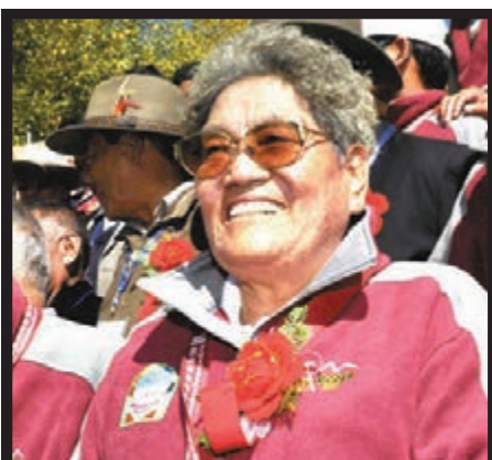
首位珠峰登頂女性潘多逝世

整個產業鏈轉移和研發成果轉化，強化經濟、社會、服務功能。此外，被稱為「七環」的北京大外環高速公路項目，預計明年全線建成。該項目建成後，河北將有京承、密涿、承平平等11條高速公路呈環狀直達北京，北京東南部現有的過境交通，尤其是貨運過境交通將逐漸轉移至北京外圍地區。