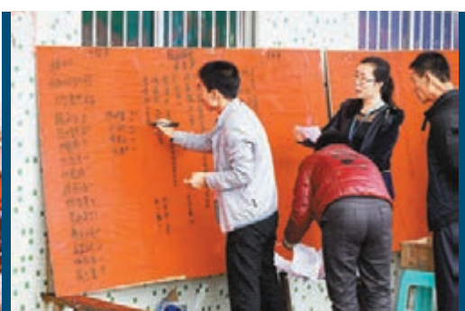
選舉結束後，工作人員在點算選票。