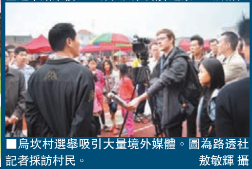
烏坎村選舉吸引大量境外媒體。圖為路透社記者採訪村民。