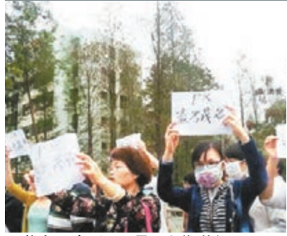
茂名民眾反PX項目上街遊行。

香港文匯報訊（記者 古寧）廣東茂名市政府新聞發言人昨日向媒體稱，廣大市民關心PX項目我們十分理解，目前該項目僅是科普階段，離啟動為時尚早。在考慮項目上馬時一定會通過各種渠道聽取公眾意見再進行決策。如絕大多數群眾反對，市政府是不會違背民意進行決策的。請廣大市民理性表達意見，共同維護社會穩定。