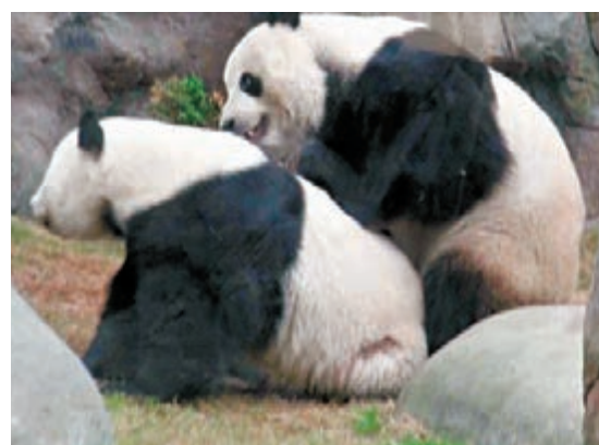
■海園將「大熊貓之旅」展館暫停對外開放，安排盈盈和樂樂共處，製造更多自然交配機會。資料圖片

海洋公園稱，希望將舊水上樂園的美好回憶再與港人連結，估計興建水上樂園的一次性經濟效益達12.6億元，水上樂園每年營運及為本港旅遊業帶來之經濟效益有8.42億元（2018年）至12.4億元（2048年），並可創造2,900個至4,290個職位。