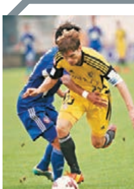
飛馬前鋒麥基進攻受阻。