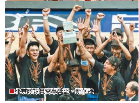
北京隊球員高舉獎盃。