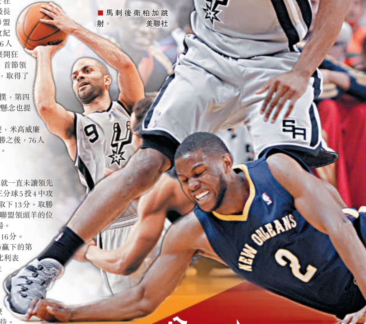
馬刺前鋒李安納特(上)成功避過對手的偷襲。