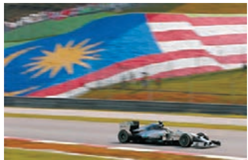
咸美頓大馬站揚威。

咸美頓稱，他在比賽的尾聲遭遇到高溫和高濕度的嚴苛考驗，他也感謝車隊全員在這樣的酷暑下完成工作。「今(昨)天的天氣讓你在進入賽車之前就濕透了，所以讓你的身體保持冷靜專注在比賽上是非常重要的。車隊的主要關注點是進站和降溫，以及通知比賽信息。這是多棒的一台賽車，每個人都做得太棒了！」咸美頓最後說道。