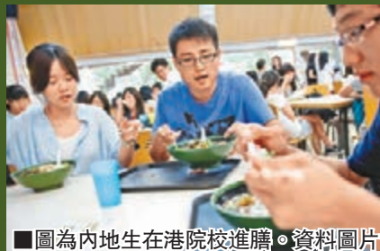
■圖為內地生在港院校進膳。資料圖片

此外，居住環境惡劣亦是「港漂」難以克服的一環。誠然，有能力赴港升學的內地生大多出身自中產、甚至富裕家庭，他們的生活條件本已不俗，惟赴港則需「蝸居」，令他們難以適應。他們本身的條件佳，累積幾年工作經驗後，或會離港尋求更理想發展機會。