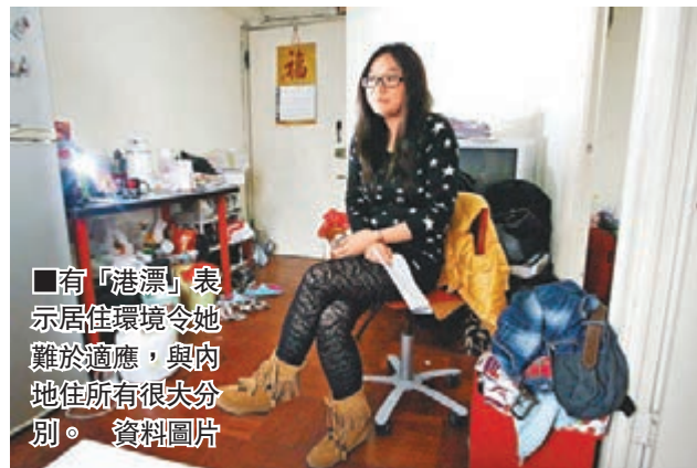
■有「港漂」表示居住環境令她難以適應，與內地居住所有很大分別。

有意見指，隨着兩地交流更趨頻密，出現了一些爭議。其成因眾多，難以一概而論，筆者將之簡化歸納為「價值分歧」和「資源分配矛盾」。去年6月，有香港網民登報反對「港漂」，認為內地生「爭書讀」、「爭工做」。誠然，教