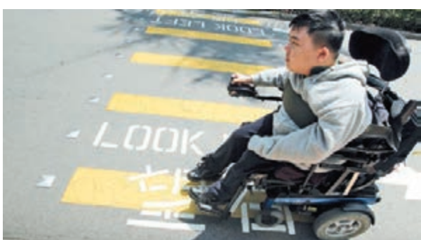
像中大這樣的「山中學府」,交通是文杰的一大難題。

運作到傍晚,就業講座一講就到晚上八九點,面對中大這樣的「山中學府」,他亦很難回到宿舍,「所以只能預約外面的車輛,但每次要300元,要不然我就直接回家,到第二天再回到學校」。