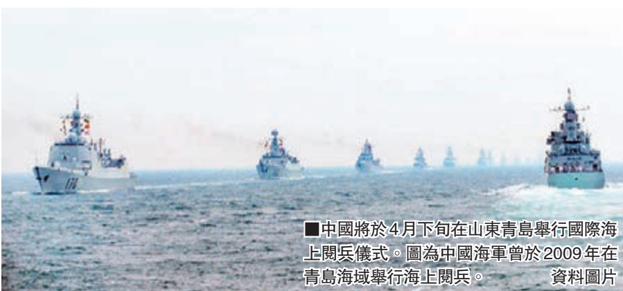
中國將於4月下旬在山東青島舉行國際海上閱兵儀式。圖為中國海軍曾於2009年在青島海域舉行海上閱兵。 資料圖片

本報聯繫青島當地消息人士稱,每年青島都會在4月舉行「軍艦開放日」等一系列海軍紀念活動,目前還未了解青島於今年舉行海上閱兵式的相關消息。但有內地軍事論壇稱,在4月23日會在青島舉行紀念海軍成立65周年海上閱兵式活動,並