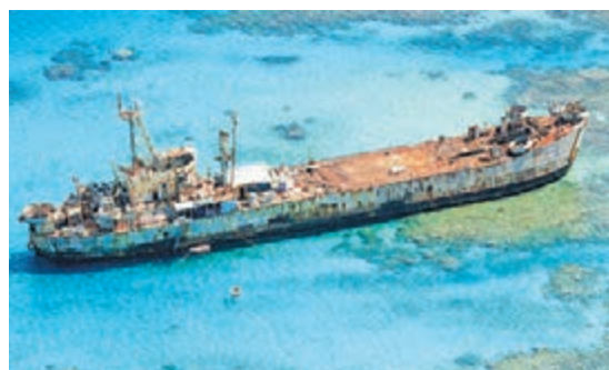
在仁愛礁非法坐灘的菲律賓登陸艦。