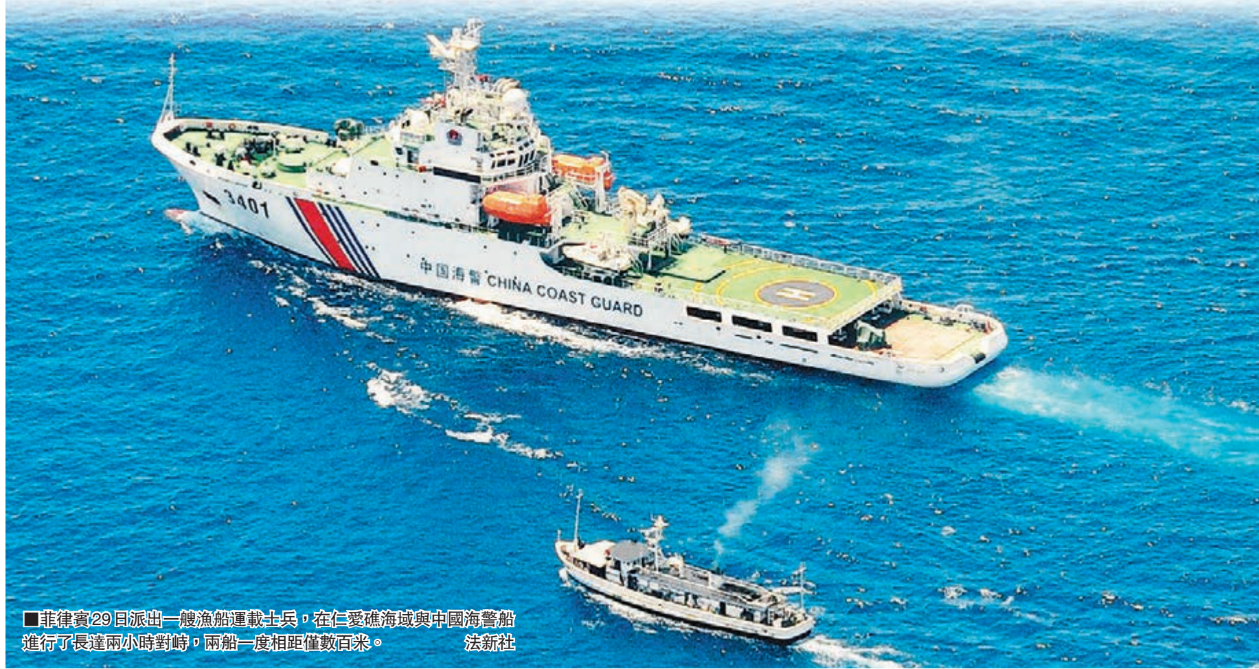
菲律賓29日派出一艘漁船運載士兵,在仁愛礁海域與中國海警船進行了長達兩小時對峙,兩船一度相距僅數百米。