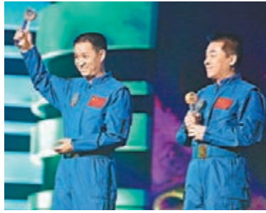
聶海勝、張曉光(右)。

張曉光稱,回顧十幾年追夢歷程,這個時代為實現夢想提供了廣闊的舞台。但是獲得成功真的很不容易。只有始終保持淡定的心態,腳踏實地,持之以恆,才能實現個人夢想。