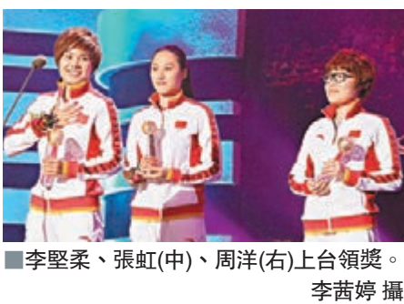
李堅柔、張虹(中)、周洋(右)上台領獎。

在2014年索契冬奧會上,中國代表團收穫了3枚金牌、4枚銀牌和2枚銅牌,位居獎牌榜第12位,仍然保持在冬奧會的第二集團,穩固了在冬奧會競爭格局中的地位。李堅柔在短道速滑女子500米決賽中為中國代表團贏得首枚金牌,讓中國隊實現了該項目冬奧會「四連冠」的壯舉;張虹獲得速度滑冰女子1,000米金牌,實現中國在冬奧會基礎大項金牌「零的突破」;周洋獲得短道速滑女子1,500米冠軍,為中國隊奪得索契第三金,也成為冬奧會歷史上成功衛冕該項目的第一人。