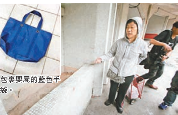
包裹嬰兒的藍色手挽袋。

被遺棄女嬰約30周大，國籍未明，身上沒有傷痕，被發現時身上連着臍帶及胎盤，相信剛出生不久即遭拋棄，送醫院搶救後證實死亡。 拾荒者好奇 查看揭發 現場是李鄭屋邨孝慈樓地下香港心理衛生會李鄭屋宿舍外的花槽，現場消息稱，前晚9時許有女拾荒者途經上址時，發現花槽上放有一個白色膠袋，好奇打開查看赫見內有嬰兒，大驚立即通知宿舍一名姓劉職員走出查看，發現屬實後報警。 大批警員接報將現場封鎖調查，並將女嬰送院，但證實已明顯死亡，屍體送驗屍房等候法醫剖驗。警方其後搜索邨內多個垃圾桶及花槽，又召來搜索犬協助蒐證。深水埗警區重案組接手調查後，探員翻看孝慈樓及附近多幢大廈的閉路電視錄影片段，