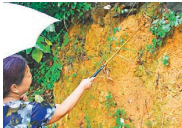
石澳女村民指長有羅漢松的位置現只剩黃土。

「他們被捕時無反抗，場面平靜……」懷疑「斬樹黨」乘坐逃走的9號巴士杜姓車長稱，其巴士昨晨由石澳開出，途至石澳道鶴咀埋站，該3名男子便上車，其中一人以普通話查詢車費：「多少錢？」杜答稱6.9元，對方放入21元，3人登車時並無攜物，上車後即逕走到下層車尾坐下。