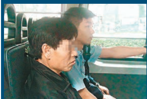
懷疑是斬樹黨的內地漢被捕帶署。