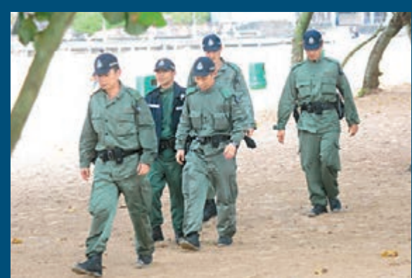
機動部隊警員增援到石澳搜捕疑人。