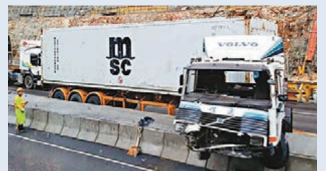
在黃雨期間，貨櫃車避車失控上路。