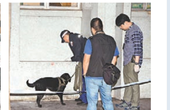
警方召來搜索犬協助蒐證。