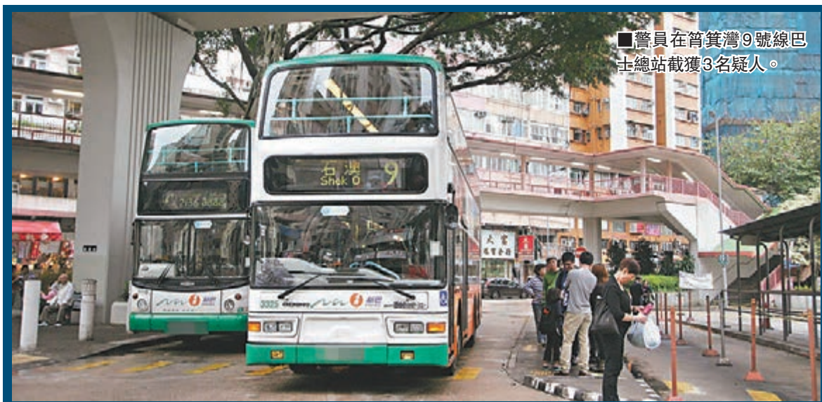
警員在筲箕灣9號線巴士總站截獲3名疑人。

至昨凌晨近1時，一隊機動部隊警員到場增援，並帶同警犬上山摸黑搜索。其間大霧籠罩石澳，能見度僅約100米，奉召支援的飛行服務隊直升機亦因天氣惡劣而折返。警員惟有冒險於黑暗及濃霧中攀過懸崖峭壁搜捕，過程驚險。直至清晨，另一批衝鋒隊警員接力再上山搜捕，惜當時大霧更濃，難於草叢中發現可疑人。及至中午濃霧漸散，警方立即分頭從水陸兩路進發到開槍現場蒐證，其後帶走2棵已被砍伐的羅漢松，幾塊