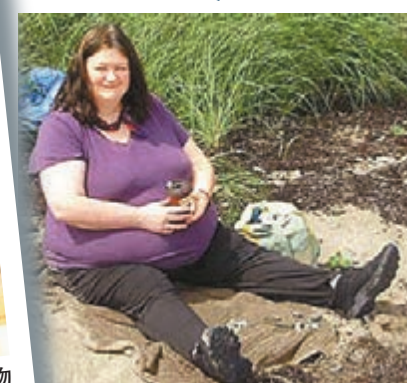
■伊金斯減肥前重130公斤。 網上圖片