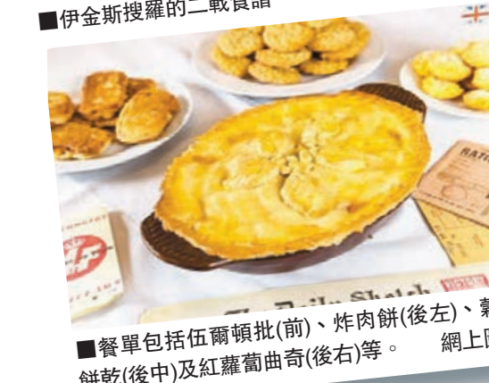
■餐單包括伍爾頓批(前)、炸肉餅(後左)、穀物餅乾(後中)及紅蘿蔔曲奇(後右)等。