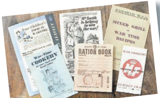
■伊金斯搜羅的二戰食譜。 網上圖片