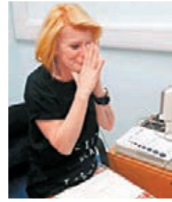
■米爾恩首次聽到外界聲音，激動不已。 網上圖片