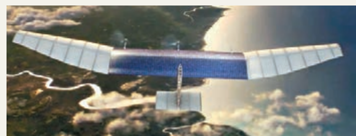
■傳送網絡的無人機概念圖。