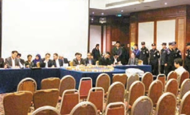
■家屬溝通會現場，全體家屬離席。只剩1名家屬代表與之交涉。