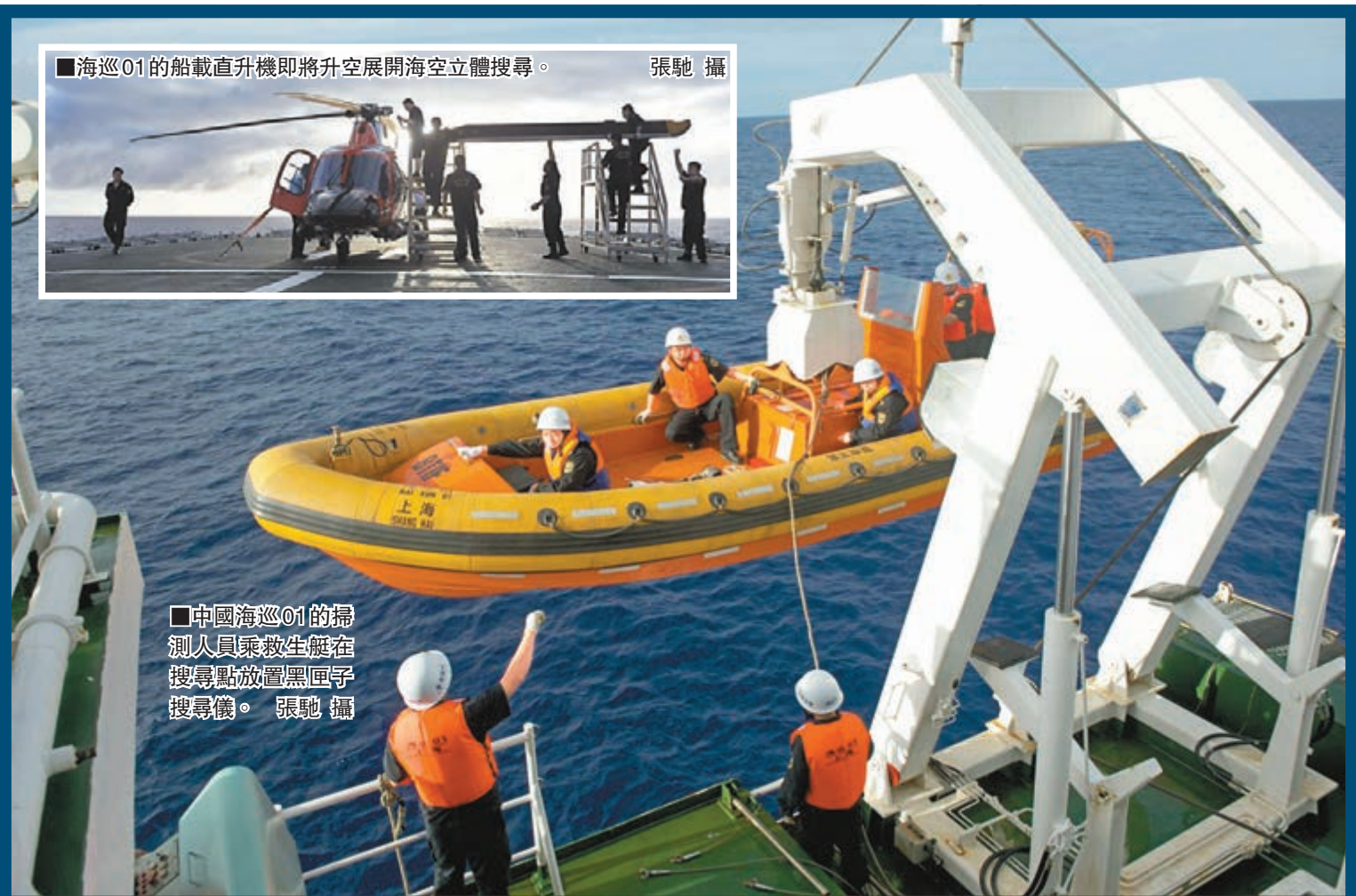
■海巡01的船載直升機即將升空展開海空立體搜尋。

提供 10 萬元人民幣慰問金。攜程旅行網也表態，不推薦遊客前往馬來西亞。而同程旅遊網則以「這是我們的態度」公告，無期限停售所有馬航產品。去哪兒網也已下架馬航相關產品。 據位於上海的驢媽媽旅遊網相關人士介紹，目前赴馬來西亞首都吉隆坡的客流下降了 50% 以上。