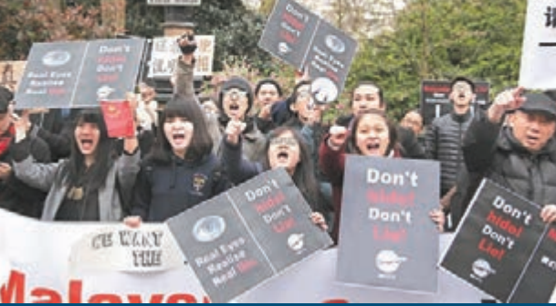
■二百多名英國華人和留學生27日在馬來西亞駐英使館前舉行抗議活動，表達對大馬在處理MH370失聯事件上的不滿，並遞交抗議書。

香港文匯報訊（記者 高麗丹 北京報道）「在這次搜救活動中，我們用了 FDR（飛行數據記錄器）、CVR（語音記錄器），他們的作用是……」昨日馬航 MH370 失聯乘客家屬溝通會上，整整 80 分鐘，馬方不斷以讓人難懂的枯柴術語回應提問，未透露任何關鍵信息，也沒有解答家屬最關心的「飛機在哪裡」的關鍵問題，全場家屬憤然離席。只剩下 1 位家屬委員會代表提問。在得到馬方模稜兩可的回應後，全體家屬再次舉行會議，欲包機前往馬來西亞，尋找飛機失蹤真相。