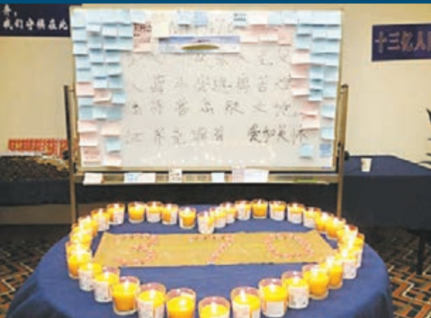
■在失聯飛機乘客祈禱室，家屬們點燃蠟燭祈福。