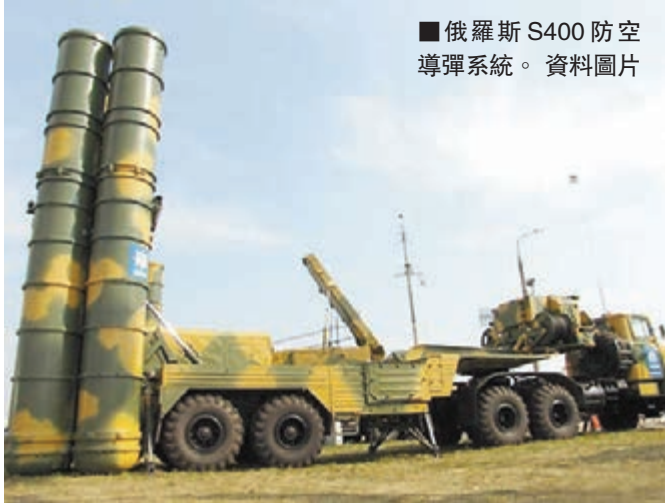
■俄羅斯 S400 防空導彈系統。 資料圖片

15 個營的 S-300PMU2 防空導彈系統和 4 套 SU83M6E2 指揮系統，已經用於保護北京、上海等大城市。 在這種情況下，報道分析，中國若再獲 S400 防空導彈系統，不僅將能控制境內領空，還能控制台灣和釣魚島的上空。 S400 防空導彈系統是俄羅斯國土防空軍第 3 代地對空導彈系統，射程達 400 公里，用於從超低空到高空、近距離到超遠程的全空域，對抗密集多目標空襲。