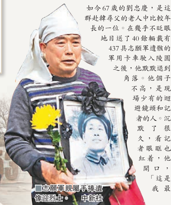
■志願軍親屬手捧遺像迎烈士。