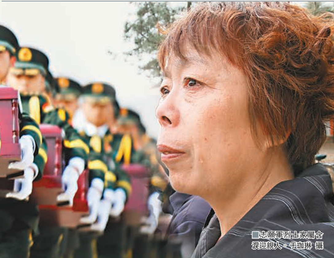
■志願軍烈士家屬含淚迎親人。于珈琳 攝