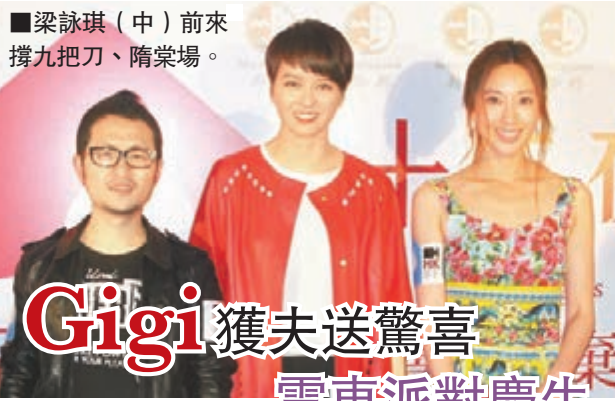
梁詠琪(中)前來撐九把刀、隋棠場。