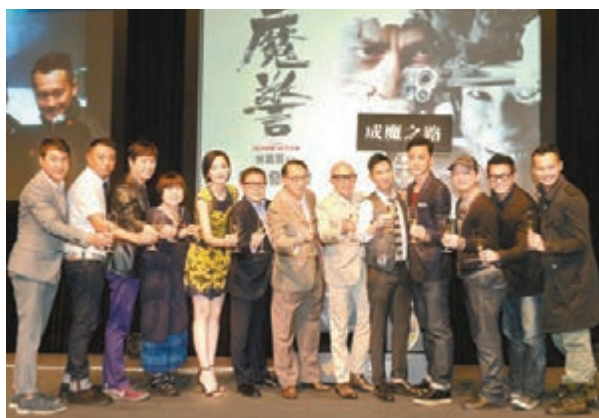
《魔警》台前幕後預祝影片票房大賣。