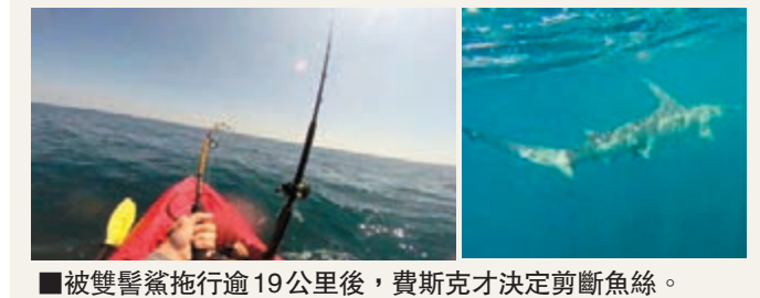
被雙鬚鯊拖行逾19公里後，費斯克才決定剪斷魚絲。