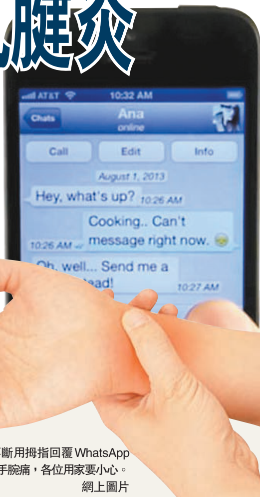
有用家不斷用拇指回覆WhatsApp訊息，導致手腕痛，各位用家要小心。