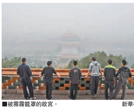
■被霧霾籠罩的故宮。

另據北京市環境部門透露，伴隨一股冷空氣的到來，空氣污染物即將快速擴散，預計今日(28日)以後北京市總體空氣質量會出現好轉，29日達到良好狀態。