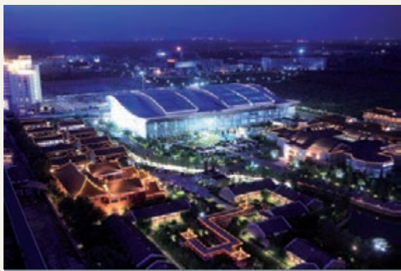
■昌平溫泉療養地——溫都水城夜景

香港文匯報訊(記者郭洪波)如今說到昌平旅遊，就不得不提「愛上昌平」系列活動，近年以來，昌平區旅遊委根據春、夏、秋、冬四季的不同景物，每年策劃編排20多條旅遊線路，涉及歷史文化、自然風光、軍事體驗等眾多內容，系列活動的推出，無論在網絡世界還是現實生活中都反響強烈，如今昌平旅遊無淡季的概念正被越來越多的旅遊愛好者所關注和認可。