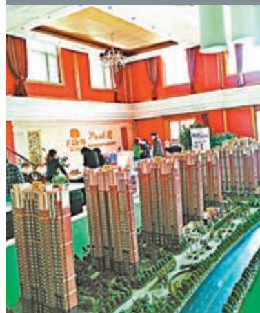
■來保定看房的客戶大增，交投暢旺。圖為保定某售樓處。

香港文匯報訊(記者張帆、高忠 石家莊報道)隨着京津冀一體化的利好消息，保定樓市成為近期最熱的話題和關注的焦點。與此同時，