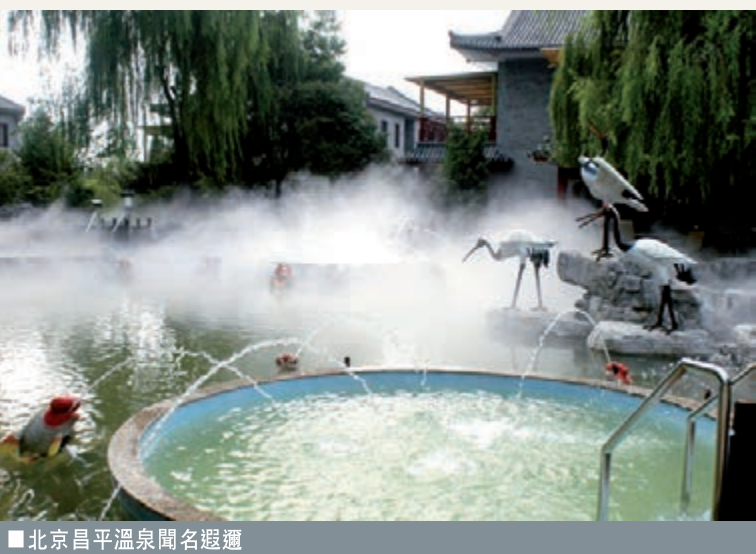
■北京昌平溫泉聞名遐邇

的中國開發利用較早的溫泉統計表明，在全國開發利用在100年以上的27家溫泉中，昌平小湯山溫泉以1,500多年(北魏)的歷史排名第9位。在中礦聯地熱專業委員會發佈的中國較早投入勘查的天然溫泉統計中表明，昌平小湯山在1956年實施勘查，在全國68個溫泉中排名第一。