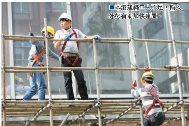
■本港建築工人不足，輸入外勞有助加快建屋。

香港文匯報訊（記者 周紹基）財政司長曾俊華在今年的預算案提到，最快7年後，本港便可能出現結構性財赤。長遠財政計劃工作小組推算香港經濟未來的二三十年間，每年平均增長為2.8%。財經事務及庫務局局長陳家強在接受訪問時表示，2.8%這個預測其實頗樂觀，但與其浪費精力去討論這個推算結果，究竟準確與否，倒不如實事求是，及早努力，發展好本港經濟，盡量使赤字的預期沒法實現。他指出，未來「人力」與「土地」兩大資源，決定了香港的往後「命運」。