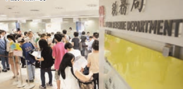
■若香港要維持低稅制，便不能大幅加稅。

他特別提醒說，本港經濟體系細小，不可能在赤字下長期靠發債維生，須繼續維持健全的財政體系，量入為出，否則本港難以維持自己的金融體系，以及發行自己的貨幣。