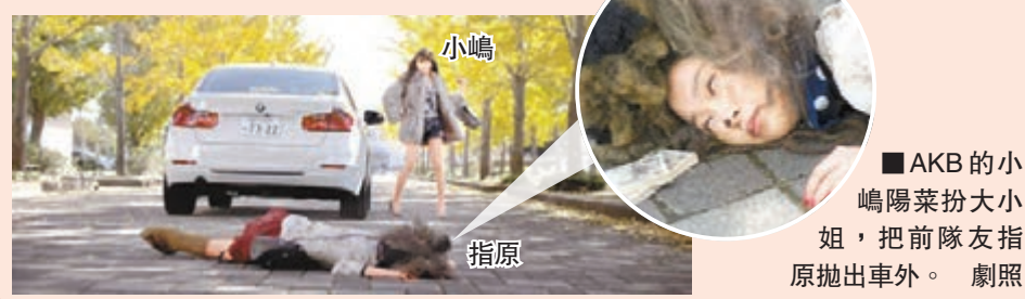
AKB的小嶋陽菜扮大小姐，把前隊友指原拋出車外。劇照

的風格。另一方面，AKB的名古屋師妹組合SKE48，新細碟《未來在哪裡》以39.8萬張銷量成今周日本細碟榜冠軍，打破AKB歷來最快拿下10次冠軍的紀錄。 文：藝能小子