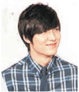
李敏鎬經秘道進入成都，讓影迷撲個空。

香港文匯報訊(記者劉銳綜合報導)今年，李敏鎬一躍成為在中國最具人氣的韓星之一，前日他空降成都，約300名粉絲在機場苦等8小時，卻撲空未果。綜合當地媒體消息，李敏鎬的成都行相當火爆，只是其中國榜金路的一個縮影。前日下午2時，双流機場已有約300位年輕女生為主的粉絲在旅客通道守候，盼能見偶像一面。儘管李敏鎬的工作人員在微博提前透露，他將走別的通道離開，但粉絲仍希望奇跡出現，有人說：「很多粉絲從早上7點就到現場，還為李敏鎬帶來成都特產，就算沒遇到也沒甚麼，能和他一個城市就很開心。」日前李敏鎬亦在微博邀粉絲力薦成都美食。