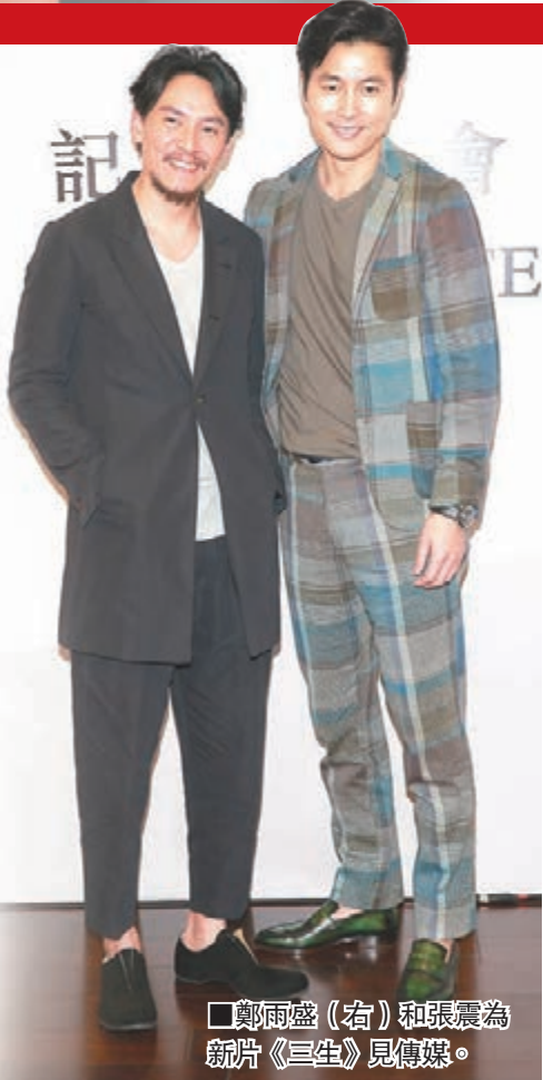
鄭雨盛(右)和張震為新片《三生》見傳媒。