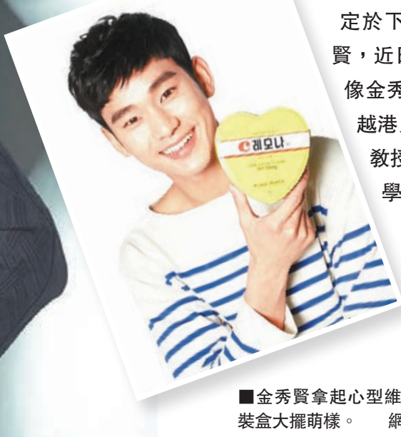
金秀賢拿起心型維他命包裝盒大擺萌樣。

定於下月來港旋風吸金的《來自星星的你》人氣韓星金秀賢，近日在兩地掀起驚人熱潮，尤其在內地更氣勢強勁。像金秀賢日前造訪江蘇衛視綜藝藝《最強大腦》，便錄得超越港人熱捧歌唱節目《我是歌手2》的絕佳收視，證明「都教授」去到邊紅到邊，料他在香港時必定引盡煲劇師奶和學生妹死跟！