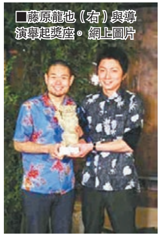
藤原龍也(右)與導演舉起獎座。

第6屆沖繩國際電影節已於前晚落幕，由日本搞笑藝人品川祐執導、男星藤原龍也主演之《三分一》獲得最高榮譽金石獅子獎，品川領獎時稱「電影是一個人無法拍攝出來的，要跟同伴們一起製作」。雖然如此，會場內卻未見藤原蹤影，導演大爆原來當日藤原於韓國的機場迷路，無法乘飛機及時趕返沖繩，到後來才珊珊來遲跟品川齊舉獎座補拍合照。至於另一齣電影《鐘擺人生》的中村獅童和小西真奈美，則分別榮獲男女主角獎項。 文：藝能小子