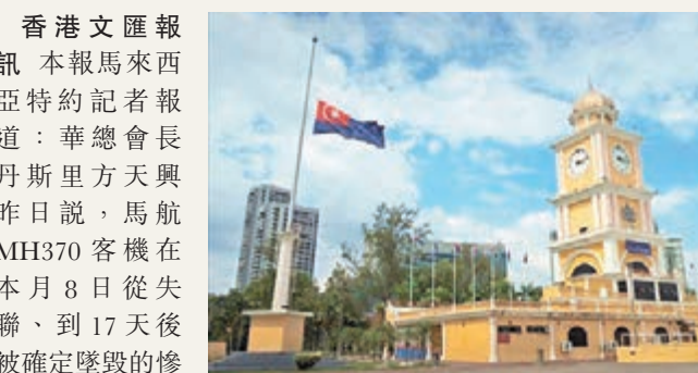
新山市政局廣場前的大鐘樓下半旗。