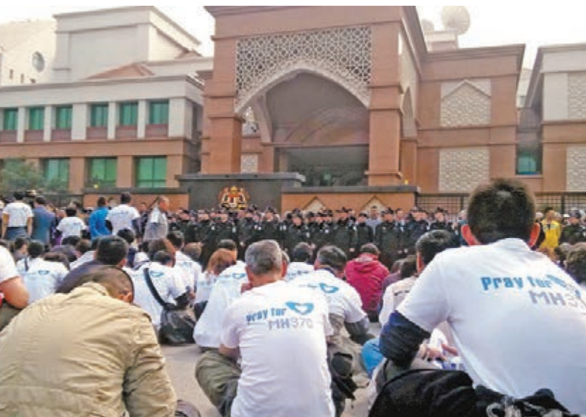
昨日在北京，馬航家屬們在馬駐中國大使館門口靜坐等馬方接收抗議書。

伊斯甘達稱，在這個最悲切的時刻，他代表馬來西亞政府，向全體家屬表達最深切的同情。他承諾，為所有乘客家屬提供生活保障是馬方目前最重要的事情。他還透露，馬來西亞高級技術團隊於今日抵達北京，並會和失聯乘客家屬就技術問題進行解釋。他說，家屬們的信件目前已經轉達給馬來西亞政府。對於家屬此前的一切舉動，伊斯甘達坦言「行為可以