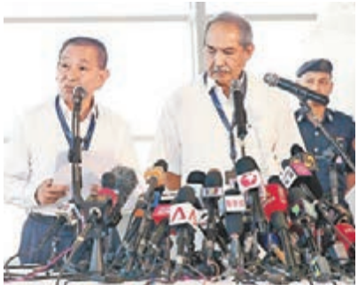
馬航首席執行官阿末佐哈里(前左)和主席尤索夫表示，獲當局批准後將安排家屬前往出事地點。

香港文匯報訊(記者田一涵、張聰北京綜合消息)馬來西亞政府周一宣布，相信失蹤超過半個月的馬航MH370客機，已經在南印度洋墜毀，估計機上無人生還。馬航主席尤索夫及首席執行官阿末佐哈里昨日中午在吉隆坡機場召開記者會，稱並不清楚這次事故發生的原因。尤索夫形容，今次客機失蹤是「前所未見」，籲家屬要接受現實。