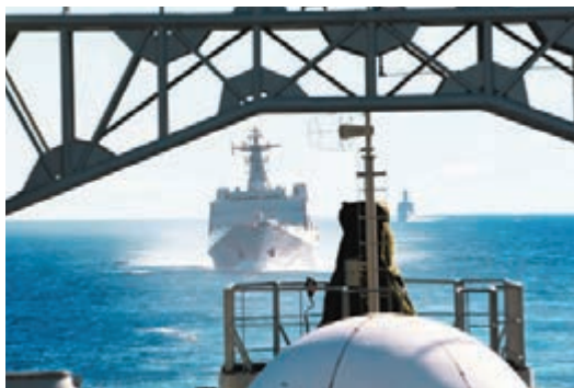
中國海軍的第一批艦艇將於26日早上抵達南印度洋的目標海域開展搜救工作。

香港文匯報訊 綜合消息：經過連續5天多的高速航行，中國海軍的第一批艦艇將於26日早上抵達南印度洋的目標海域開展搜救工作。這個搜救艦艇編隊是由千島湖艦、崑崙山艦和海口艦組成的，編隊還攜帶了兩架艦載直升機和黑盒探測儀等一些搜救設備。在這幾天的航渡過程中，搜尋編隊當中的潛水分隊、掃測分隊、醫療分隊和艦載直升機組也都進行了多次的針對性訓練。