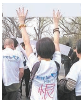
一位年輕女士T恤上的「恨」字格外醒目。