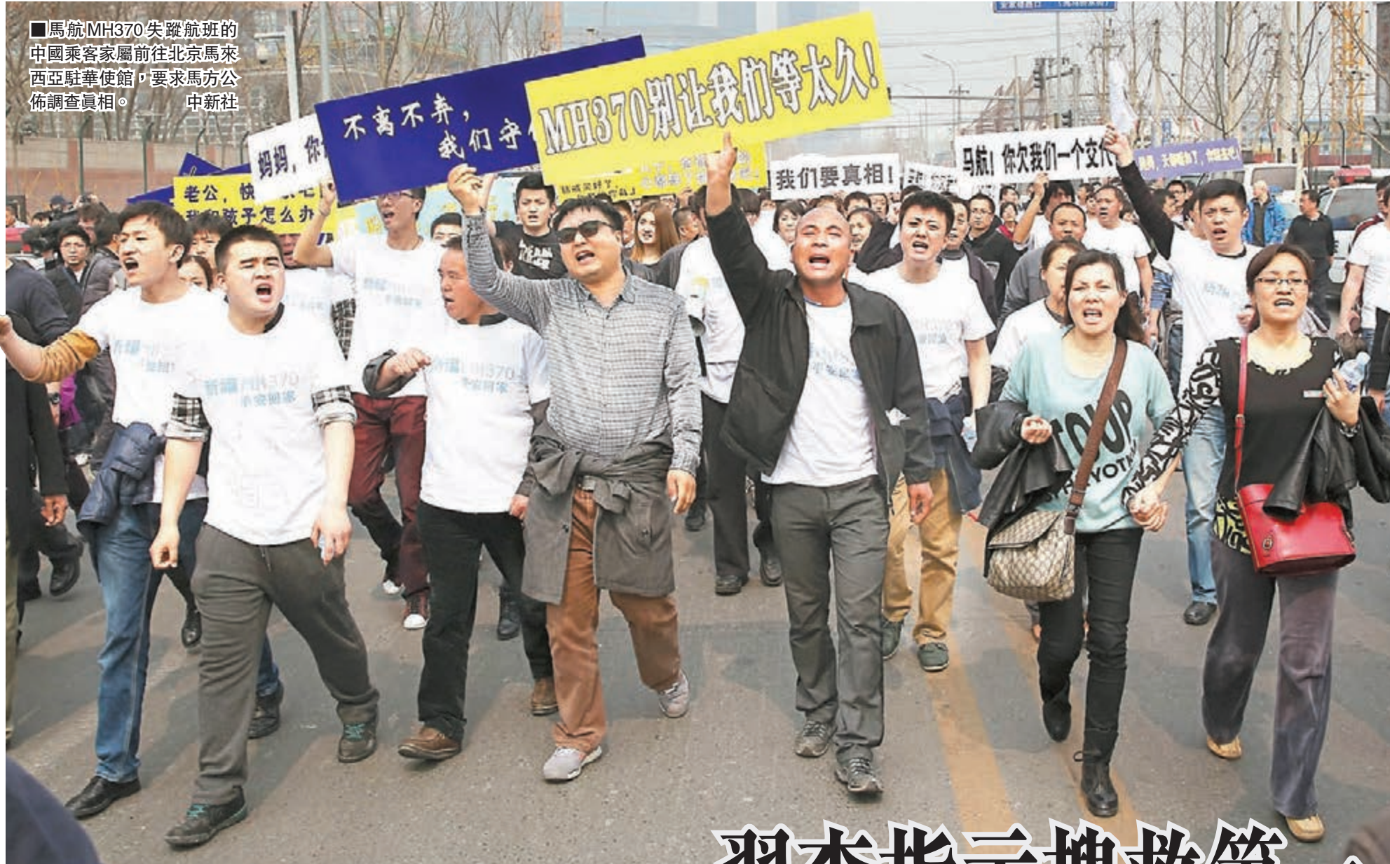
馬航MH370失蹤航班的中國乘客家屬前往北京馬來西亞駐華使館，要求馬方公佈調查真相。