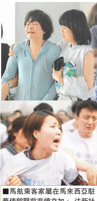
馬航乘客家屬在馬來西亞駐華使館門前悲憤交加。