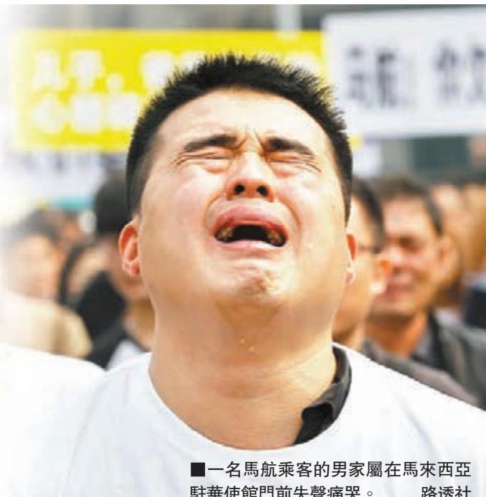
一名馬航乘客的馬家屬在馬來西亞駐華使館門前失聲痛哭。

李克強昨日上午主持召開國務院常務會議，聽取了馬方發布馬航客機失蹤事件最新信息後的情況匯報。會議強調，中國政府對中國乘客親屬的艱難處境和悲痛心情感同身受。當前搜救工作仍是第一要務；要求馬方提供更加詳細準確的信息，嚴格遵守國際公約，繼續協調國際社會力量全力搜救，吸收中方專家組深度介入事故調查工作。中國在前方一線海域的全部搜救力量要繼續傾力投入搜救，絕不放棄努力。國務院辦公廳要加強統籌協調，繼續為乘客親屬提供悉心周到的醫療、心理、法律等幫助，尤其要精心做好出現健康疾患親屬的治療和護理，確保他們的身體健康，政府將切實維護中國公民的合法權益。