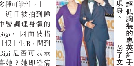
■穿上超低胸裝的惠英紅手繞。