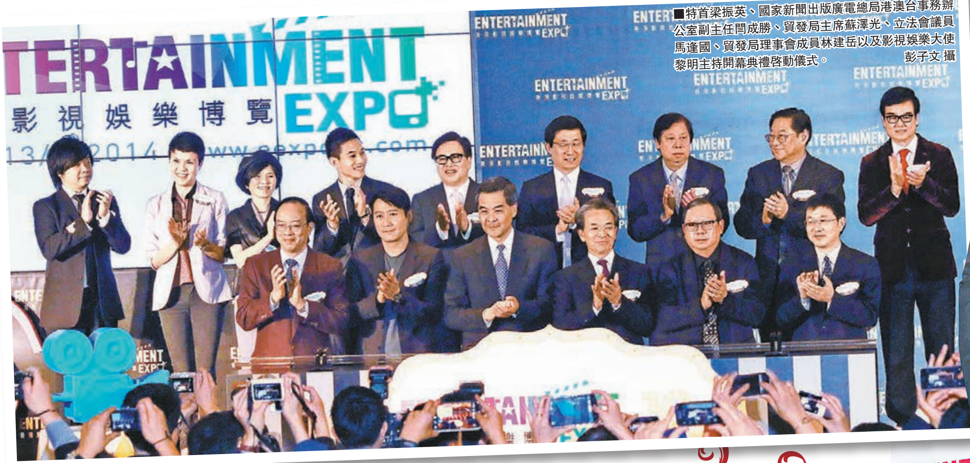
■特首梁振英、國家新聞出版廣電總局港澳事務辦公室副主任閻成勝、貿發局主席蘇澤光、立法會議員馬逢國、貿發局理事會成員林建岳以及影視娛樂大使黎明主持開幕典禮啓動儀式。