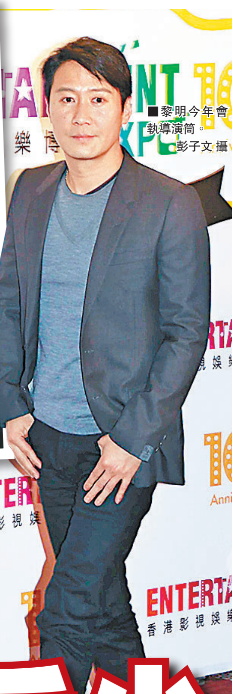
■黎明今年會執導演筒。