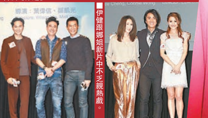
■伊健跟娜姐新片中不乏親熱戲。