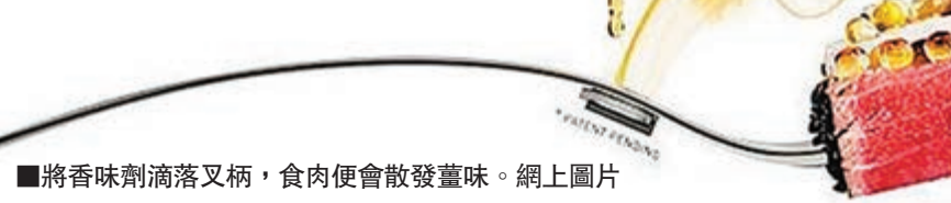
將香味劑滴落叉柄，食肉便會散發香味。

研發新叉的MOLECULE-R Flavors公司主席庫蒂表示，最初概念是改良傳統叉，透過散發強烈的香味來戲弄人，亦希望令用家懂得如何欣賞食物。 ■《每日郵報》