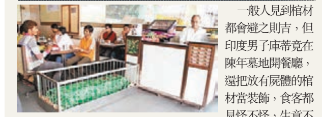
棺材旁用餐，考食客膽量。