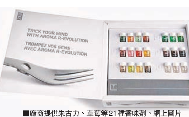
廠商提供朱古力、草莓等21種香味劑。

加拿大一家公司發明革命性金屬「香味叉」(Aromafork)，用家品嚐美食時，可隨時加入荔枝、墨西哥青辣椒、日本芥末等香味劑，邊食邊散發香味，增添樂趣。一套4支的「香味叉」連同香味劑及50張吸味紙，惠惠36英鎊(約460港元)。