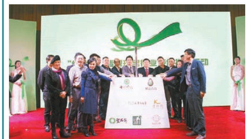
「綠絲帶」翡翠珠寶行業誠信推廣行動正式啟動。

香港文匯報訊(記者 馮鐵、倪婷 昆明報道)由雲南省國土資源廳、雲南省質監局珠寶玉石質量監督檢驗研究院等單位主辦,旨在建立翡翠珠寶行業長效監督體系,實現「建立行業誠信體系,傳遞健康消費理念」目標的「綠絲帶」翡翠珠寶行業誠信推廣行動在昆明市啟動。