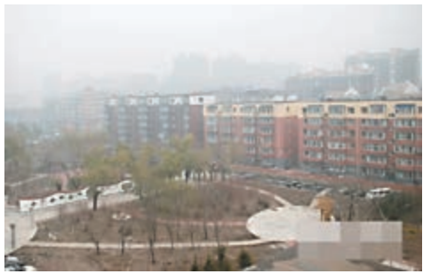
吉林省是內地受霧霾困擾的省份之一。

此外,吉林省發改委、環保廳、科技廳、工信廳、能源局等部門,將聯手推出多項措施控制霧霾,具體包括控制煤炭消費總量等工程,並加快淘汰老舊機動車、推廣使用新能源汽車、強化科技研發和推廣等。