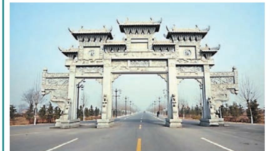
晉國博物館大道景觀門。

晉國博物館位於山西曲沃縣曲村,上世紀90年代初,此處發現、出土西周時期9組19座晉國早期晉侯和夫人墓葬及9座陪祀車馬坑,出土各類珍貴文物1萬2千餘件。其中,一號車馬坑出土戰車48輛,戰馬百餘匹,是目前中國出土的西周時期規模最大的車馬坑。如今,山西博物院鎮館之寶「鳥尊」、上海博物院展出的「晉侯蘇鐘」等重量級文物,堪稱國寶之經典。