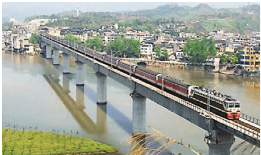
懷化市由數條鐵路構成「大」字形的鐵路大動脈,輻射到不同地區。圖為渝懷鐵路。

香港文匯報訊(記者 彭英、董曉楠 湖南報道)湖南省懷化市是武陵山集中連片的貧困區,它要利用獨特區位條件、便捷交通優勢,構築商貿物流中心。全市通過狠抓節能降耗和污染減排,近三年懷化市已關停近百家污染企業。懷化市現包括西部汽車貿易城、中藥材市場、建材市場等在內的十大專業批發市場,並有以步步高、大潤發為首的一批電商企業入駐,發展態勢良好。此外有多條鐵路線途經懷化市,市內並設有機場,有利物流發展。