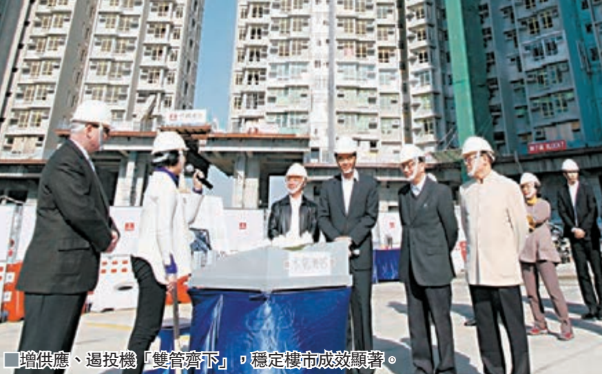
■增供應遏投機 穩樓市成效顯。

香港文匯報訊(記者 鄭治祖) 香港正值迎接普選的關鍵時刻。為與社會「有商有量落實普選」，行政長官梁振英去年10月宣布成立由政務司司長林鄭月娥領導的「政改諮詢專責小組」，並於去年底發表諮詢文件，正式啟動動次歷程，為期5個月的公眾諮詢，努力達至2017年「一人一票」的特首普選目標。針對地區行政完善，梁振英宣布於深水埗及元朗推行先導計劃，給予民政專員於地區管理委員會持決策權，處理部分涉及公共地方等問題。 依法凝聚最大共識 今屆政府任內積極推動行政及政制循序漸進發展，包括去年9月順利舉行立法會選舉，落實「一人兩票」安排，並於去年5月完成立法程序，由2016年第五屆區議會任期開始，全面取消區議會委任議席。此外， 整理收集到的意見，依循政制發展「五步曲」開展工作。 梁振英先後多次強調，要達至2017年普選特首的目標，特首選舉及立法會選舉必須嚴格按照基本法規定及全國人大常委會的相關解釋和《決定》落實，凝聚最大共識。他早前赴全國「兩會」召開期間，向中央建議安排全體立法會議員訪問上海，並獲得接納。 推行地區先導計劃 此外，為履行競選提出的「地區問題地區解決、地區機遇地區掌握」理念，梁振英於今年度施政報告宣布，於深水埗及元朗兩區推行先導計劃，給予民政專員於地區管理委員會持決策權，處理部分涉及公共地方等問題，並由區議會就工作優先提供意見。政府會增撥人手和資源推行先導計劃，藉以累積經驗，未來再研究如何有效地逐步擴大。