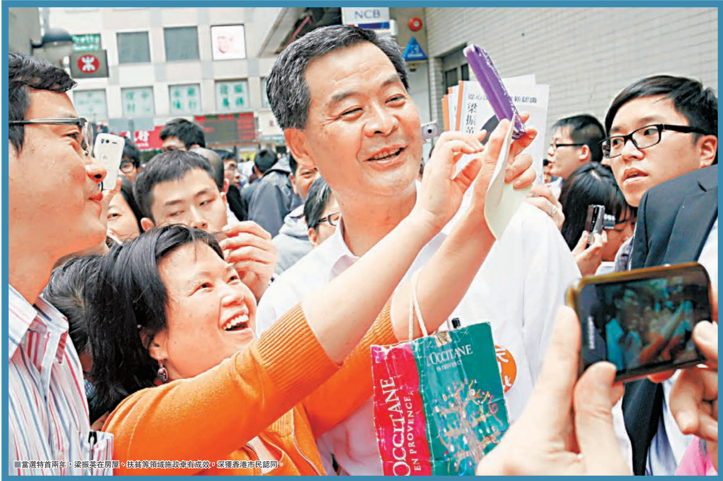
■當選特首兩年，梁振英在房屋、扶貧等領域施政有成效，深受香港市民認同。

一張票一枝筆 18區聽民意 梁振英帶着一張摺凳、一枝筆、一本簿，與親隨隊員不停踏遍18區，在各區舉辦「齊心寫政綱」諮詢會，近距離接觸各階層的市民及大小企業，以至接受選委的質詢及聆聽選委意見。 除了聽取市民的意見，梁振英在「齊心寫政綱」活動期間，接獲約500份至600份意見書。在「增刪潤飾」後，梁振英於2012年3月發表以「行之正道、穩中求變」為題的競選政綱總綱，當中由各界專家、學者與親隨隊共同草擬，匯聚了眾人智慧，有灣仔中產的心聲，有大嶼山企業的願景，也有屯門清溪江的訴求。 梁振英強調，他的政綱不只是一份競選政綱，而是一份執政政綱，提出包含了11個範疇，涉及人口政策、土地規劃、房屋、教育、社會福利、體育、環境保護及行政及政治體制等。當中共提出了不少施政專責委員會，包括完整地加入了僱員權益部分，提出就經濟工時的研究成立專責委員會，又提出檢視最低工資法的成效，定期檢視社會情況檢討水平等。 梁振英亦訂了「齊心寫政綱」的短短數月內，讓他對各界訴求有了更深刻體會，同時也肯定了他是全港市民服務的心。他並強調，他面對選舉委員會，也面向700萬香港人，把自己對於「家是香港」的願景向市民推心置腹，將自己的理念和政策綱領闡明佈告。