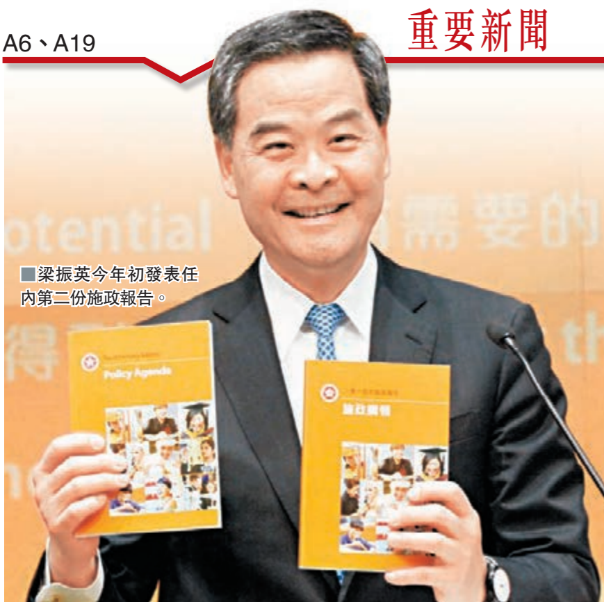
■梁振英今年初發表任內第二份施政報告。