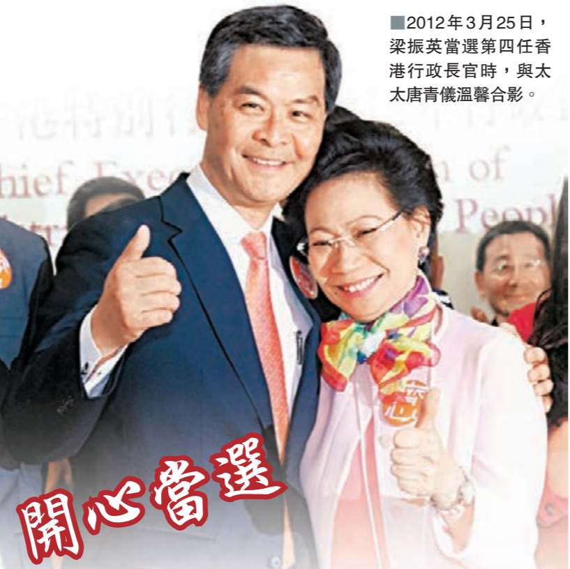
■2012年3月25日，梁振英當選第四任香港行政長官時，與太太唐菁儀溫馨合影。